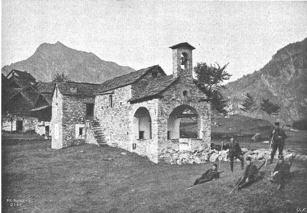
Partie bei Peccia im Maggiatal.