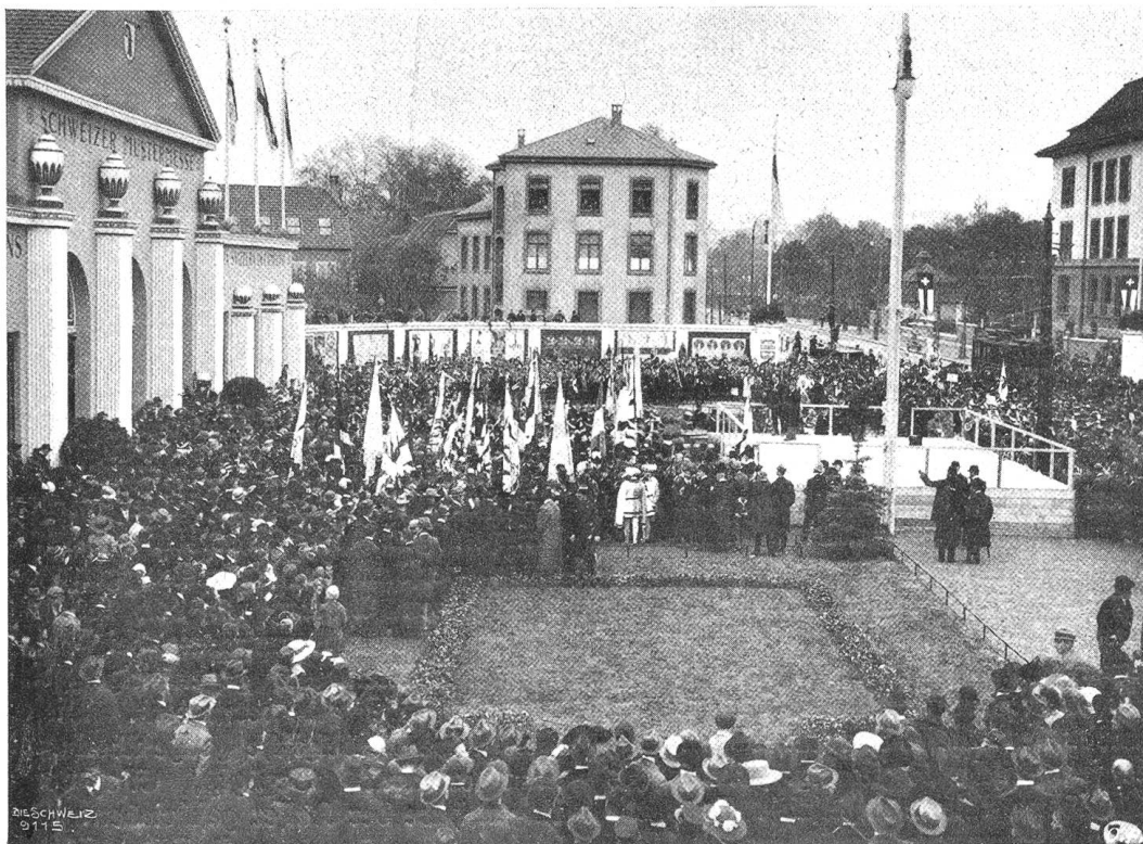
Die II. Schweiz. Mustermesse in Basel (15.—30. April 1918). Der Empfang der Welschen vor dem Messgebäude.

tera, auf französischer Seite vom Grafen Armand, der dem Pariser Kriegsministerium zugeteilt sei. Der Abbruch der Besprechungen erfolgte in den letzten Februartagen. Clemenceau replizierte, daß er die Pourparlers zwischen Revertera und Armand in der Schweiz schon bei der Uebernahme der Regierung vorfand und daß er sie nicht abbrechen ließ, um sich eine nützliche Informationsquelle zu erhalten. Frankreichs Vertreter hatte die Instruktion, sich auf die Entgegennahme der österreichischen Vorschläge zu beschränken. Durch eine eigenhändige Note Reverteras werde bewiesen, daß Oesterreich=Ungarn schon im August 1917 die Initiative zu diesen Besprechungen ergriffen habe, um von Frankreich an die Adresse Oesterreichs Vorschläge zu erhalten, die nach Berlin geleitet werden sollten. Niemals sei jedoch Frankreich der Initiator dieser Besprechungen gewesen. Hierauf schob Czernin in einer weiteren Erklärung die Initiative für die Friedensunterhandlungen dem gewesenen französischen Ministerpräsidenten Ribot zu. Nun rückte Clemenceau mit einem „Haupt-schlager“ heraus: er behauptete in einem