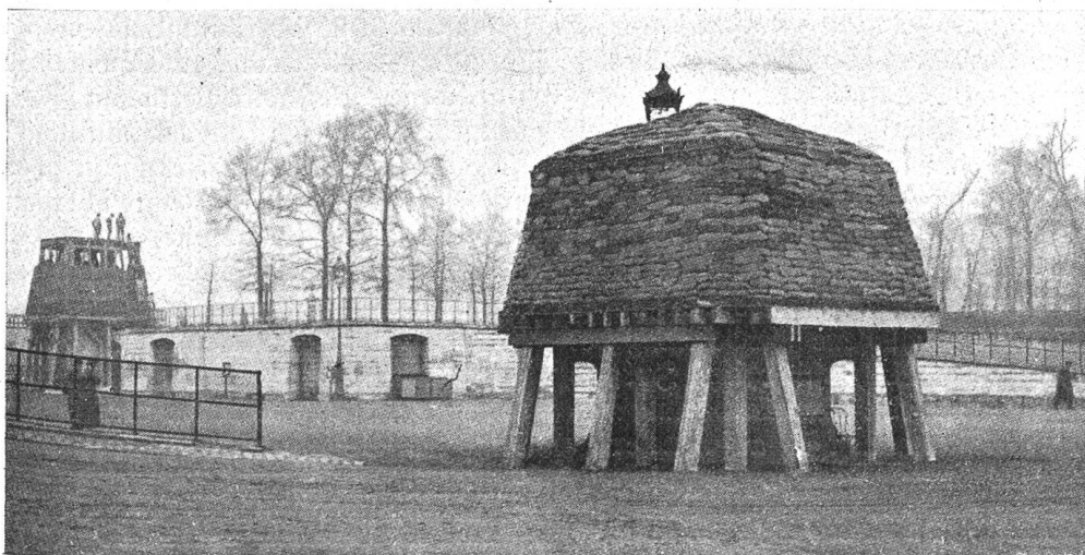
Schutzeinrichtung (gegen die Beschädigung) an Kunstwerken in den Tuileries von Paris.

Inzwischen nahm die große deutsche Offensive an der Westfront ihren blutigen Gang. Bis zu dieser Stunde ist es den Streitkräften der Entente, die am 1. April unter das einheitliche Kommando des französischen Generalissimus Foch gestellt wurden, gelungen, den deutschen