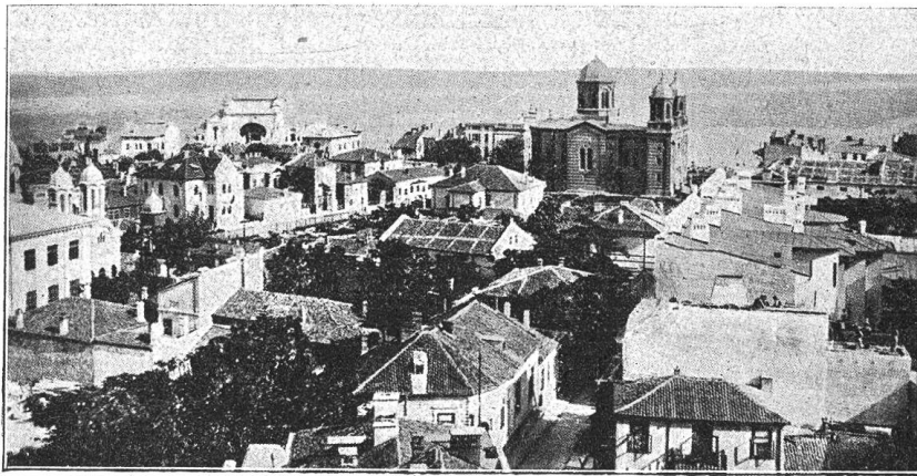
Zum Frieden der Zentralmächte mit Rumänien: Constanza, Hafenstadt in der Dobrudscha am Schwarzen Meer.

zugunsten der französischen Rückforderungsansprüche bezüglich Elsaß-Lothringens eingesetzt, wenn diese Ansprüche gerecht wären. Sie sind es jedoch nicht.“ So stand nun Behauptung gegen Behauptung. Während Frankreich die Richtigkeit des Wortlautes weiterhin konstatierte, beharrte das Wiener Auswärtige Amt auf seiner Erklärung vom 13. April und lehnte es ab, den Prinzen Sixtus oder irgendeine andere spezielle Persönlichkeit der Fälschung beschuldigt zu haben. Da man in Wien nicht feststellen könne, wo die Unterschreibung des falschen Briefes erfolgt ist, werde von dieser Seite die Angelegenheit als beendet erklärt. Kaiser Karl erklärte in einem Telegramm an Kaiser Wilhelm, daß er nicht gesonnen sei, mit Frankreich über die Angelegenheit ferner zu diskutieren. Die weitere Ant-