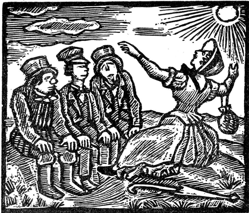
Ernst Würtemberger, Zürich. Die drei gerechten Kammacher und Züs Bünzlin. Holzschnitt.

So hat der Künstler mit seinen acht Illustrationen ein köstliches Werk geschaffen, das mit der unvergänglichen Erzählung Kellers eine Einheit an Gesinnung, ursprünglicher Kraft und künstlerischem Vermögen bildet, wie man sie nur in seltenen, besonders glückhaften Fällen an-