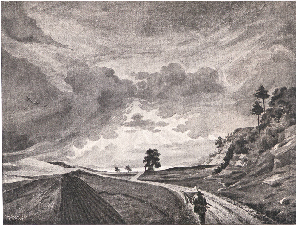
Gottfried Keller (1819—1890).