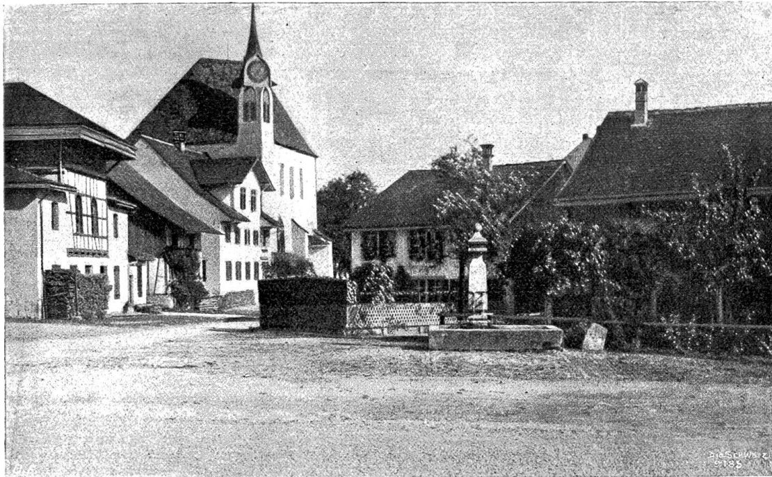
Dorfplatz in Greifensee, im Hintergrund die Kirche.