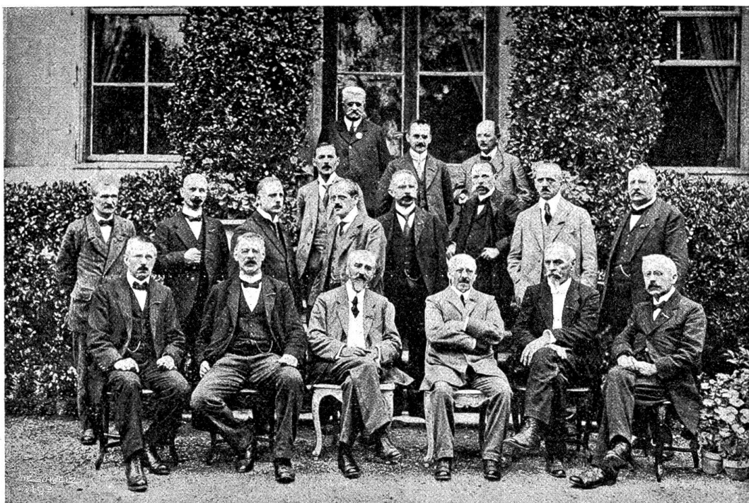
Tagung der kantonalen Staatschreiber in Genf (14. und 15. September a. c.).