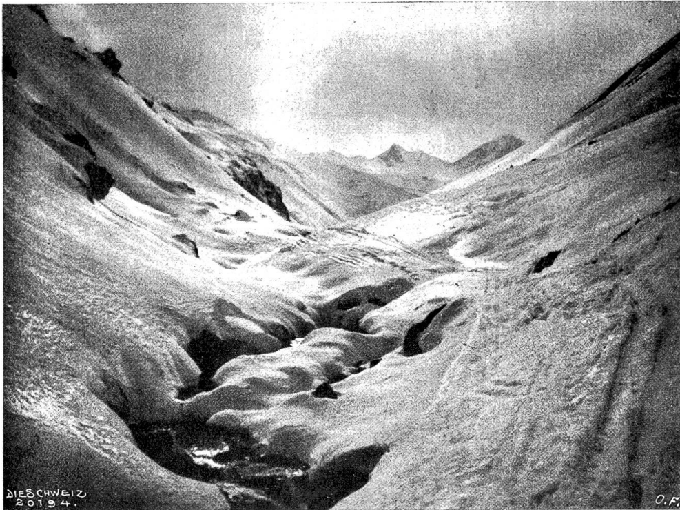
Im winterlichen Hochgebirge Abb. 7. Frühlingssonne (Muttental, Gotthard).