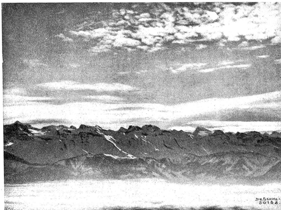
Im winterlichen Hochgebirge Abb. 5. Föhnstimmung.