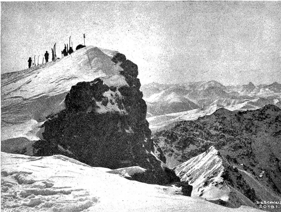
Im winterlichen Hochgebirge? Gipfelraute Abb. 4. Gipfelraute (Weißfluh bei Davos).

aus in das Reich des weißen Todes, und mich schauert: kein Flecklein, wo der Mensch ausruhend sich niederlegen kann, nichts, nichts als Eis, Schnee, Einsamkeit — Tod, eine erstarrte Welt — eine Mondlandschaft mit all ihrem blendenden Glanz und ihrer grauenvollen Melancholie. Und es zieht mich ins Tal hinunter, wo die Nester tropfen, die Säfte rollen, die Knospen treiben, die Saat keimt, die Rebe sproßt, mir ist, ich müßte heute noch dort hinabziehen — denn bald, bald werde ich wieder im grünen Grase liegen, während der Frühlingwind ein liches Gestöber von weißen Apfelblüten durch die blaue, linde Luft wirbelt ... O selig Träumen auf hohem Bergesgipfel, wenn die Sonne heiß auf die Glieder brennt und am Himmel ein weißer hoher Hirte seine Lämmer auf die blaue Weide führt! Aber meinen Kameraden darf ich nichts ver-raten von meinen Frühlingsträumen; Jakob würde es mir als Sportsmann nie verzeihen, mit scharfem Zahn an des Winters Majestät genagt zu haben; Ibrahim aber ist so mit Brechen und Beißen, Kosten und Rauen, Schlürfen und Schlecken, Schlingen und Schlucken beschäftigt, ist so in des Riechens und Füh-