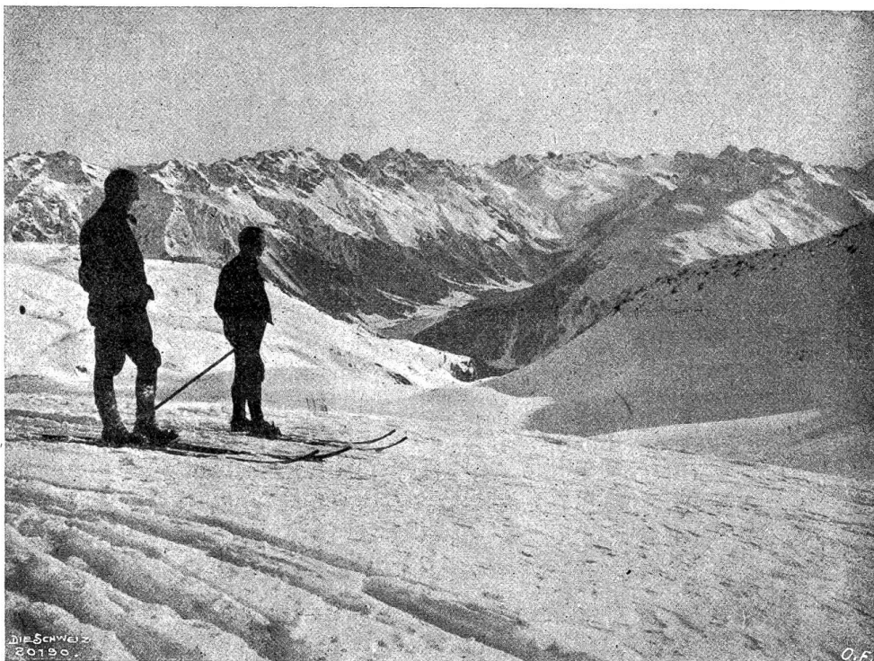
Im winterlichen Hochgebirge. Abb. 3. Ausblick ins Tal (Parfenngebiet bei Davos).

das Auge reicht, ein erstarrtes Meer von blinkendem Silber! Da ragt Spitze an Spitze, Zacke an Zacke, Grat an Grat, Hörner, Zähne, Nadeln, Stöcke, Särgе, Türme, Gewölbe, Wände, Ruinen, alle, alle wie aus Schnee und Kristall erbaut, mit zarten Schatten- und Lichttönen, immer heller, freier, beschwingter, durchsichtiger gegen den unermesslich fernen Horizont hin ... Und uns zu Füßen ungeheure weiße Felder, weiße Halden, weiße Schluchten, Hügel, Buckel, Mulden und Kessel, alle in den gleichen lichten Tönen und zartblauen Schatten hingemalt. Und gegen Westen, tief, tief unter uns, ein blaues Waldtal. Dort unten hat die strahlende Sonne gesiegt, dort bricht die braune Erde mächtig durch das weiße Todeslaten, dort tropfen die hohen Dächer, dort triefen die Bäume, dort fließen tausend und tausend Bächlein von allen Hängen, dort schäumt und tobt in der Waldschlucht der Bergbach — es ist, als hätte der Föhn dort unten, in der Rechten den blauen Schild, des Frühlings grünes Panier aufgepflanzt. Dort unten werden nun bald die kleinen Soldanellen den Lenz einläuten, der zartadrige Krokus aus seinem goldenen Becher die süße Himmelsbläue trinken ... Noch einmal schweifen meine Blicke hin-