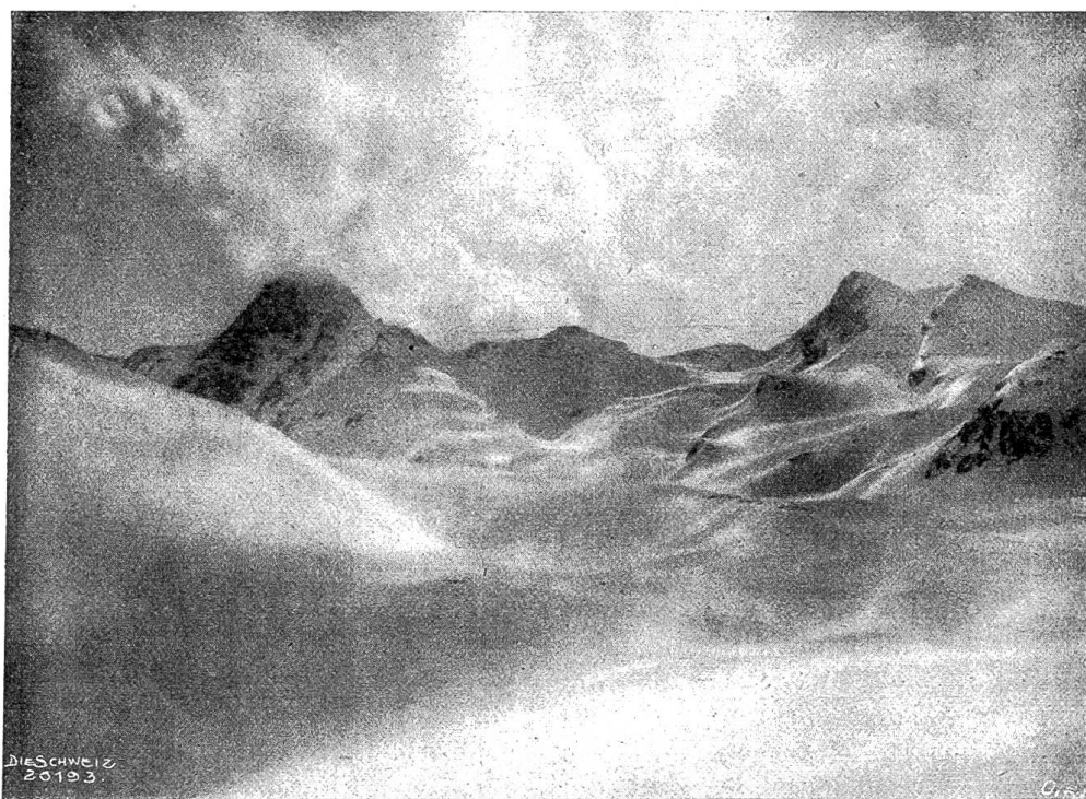
Im winterlichen Hochgebirge Abb. 6. Ideale Skifel der (Muttengletscher, Gotthard).