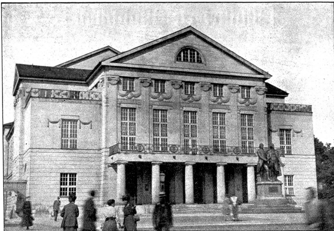
Das Theater in Weimar, z. Z. Sitz der Deutschen Nationalversammlung. Vor dem Haupteingang das Doppelstandbild Goethe und Schiller von Ernst Rietschel.

Nationalversammlung, besitzen aber für sich allein und auch mit den „Unabhängigen“ zusammen nicht die Mehrheit. Die Wahlen ergaben sowohl für das Reich wie für die Parlamente der einzelnen Staaten überall eine bürgerliche Mehrheit der Wähler, die allerdings in verschiedene Parteien auseinanderfällt. In den ersten Tagen des Februar ist dann die Nationalversammlung in Weimar tatsächlich eröffnet worden. Die Befürchtungen, daß sie noch im letzten Moment durch einen Spartacustreich gesprengt werden könnte, haben sich nicht erfüllt. Die erste Aufgabe des neuen deutschen Parlaments wird nun sein die Ausarbeitung einer neuen Reichsverfassung. Nach der Vorlage der Regierung soll an die Spitze des Deutschen Reiches ein gewählter Präsident treten, dessen Befugnisse ungefähr die Mitte halten würden zwischen den Rechten und Kompetenzen des amerikanischen Unionspräsidenten einerseits und des Königs von England andererseits. Der Präsident soll sich dann sein Kabinett nach streng parlamentarischen Grundsätzen selbst zusammenstellen. Das frühere Königreich Preu-