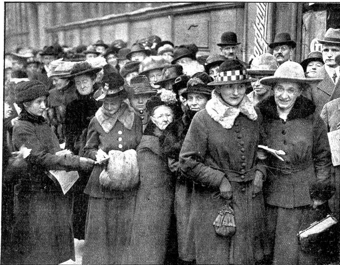
Die Wahlen zur Deutschen Nationalversammlung. Die Frauen üben ihr Stimmrecht aus.