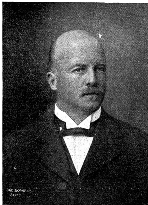
Der neuernannte Schweizerische Bundeskanzler Adolf von Steiger.

Land für sich zu gewinnen. Schon sind von der monarchischen provisorischen Regierung eine Reihe von Dekreten erlassen worden, die die Abschaffung der Republik als vollzogene Tatsache behandeln, und Ex-König Manuel in London wartet nur auf einen Wink, um sich seinem getreuen Volke wieder zur Verfügung zu stellen. Die Reaktion steht in vollem Flor. Es ist aber doch schwer zu glauben, daß es ihr tatsächlich gelingen werde, sich gegen den Zug der Zeit, der auf die Demokratie weist, abermals in Portugal festzusetzen.