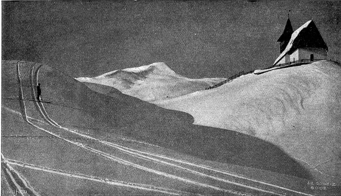
Kapelle von Inner-Rosfa.