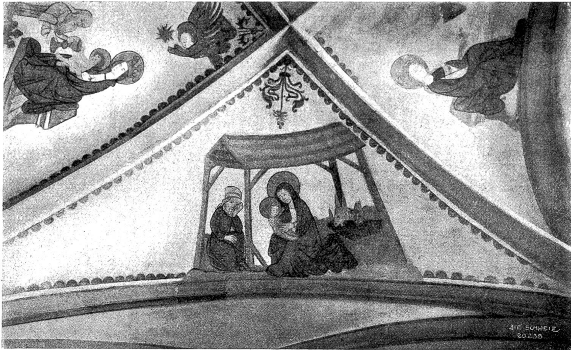
Dom Basler Münster Abb. 6. Geburt Christi zc. Fresken am östlichen (mittleren) Gewölbe der Krypta (Anfang des 15. Jh.'s).

erzählte Anselm von Canterbury in seinen Meditationen, wie Jesus am Kreuz die Arme ausbreite, um uns zu umfassen, wie er das Haupt neige, um uns zu küssen, und wie sein geöffnetes Herz seine ganze Liebe zu uns zeige. In der hl. Brigitte kommt Maria selber und erzählt ihr ihr Leiden mit furchtbaren Schilderungen der Qualen Christi. Die Hymnendichter und Prediger, die Mystikerdichter und Künstler versenkten sich in die Details der Passion; man zählt die Rutenstrieche Christi. Jede Stunde des Tages ruft ein Leiden in Erinnerung, man schwelgt in der Vorstellung der Qualen, aber man weiß auch die rührendsten Erzählungen vom Kreuzweg und von der Klage Mariä. Man dichtet Hymnen auf Lanze und Dornenkrone, die erst in gotischer Zeit dargestellt wird; Engel zeigen unter Trauern und Klagen die Passionsinstrumente; ja, es entsteht ein eigener Kultus der Wunden Christi. Gläubige sollen das Blut aus den Wunden