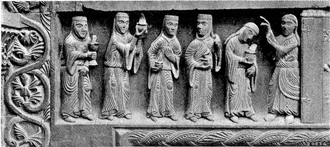
Vom Basler Münster Abb. 2. Christus und die klugen Jungfrauen, Relief am Türsturz der Galluspforte (f. Abb. 1).

dekorative Vorbilder liegen den verschiedenen Kapitellformen zugrunde.