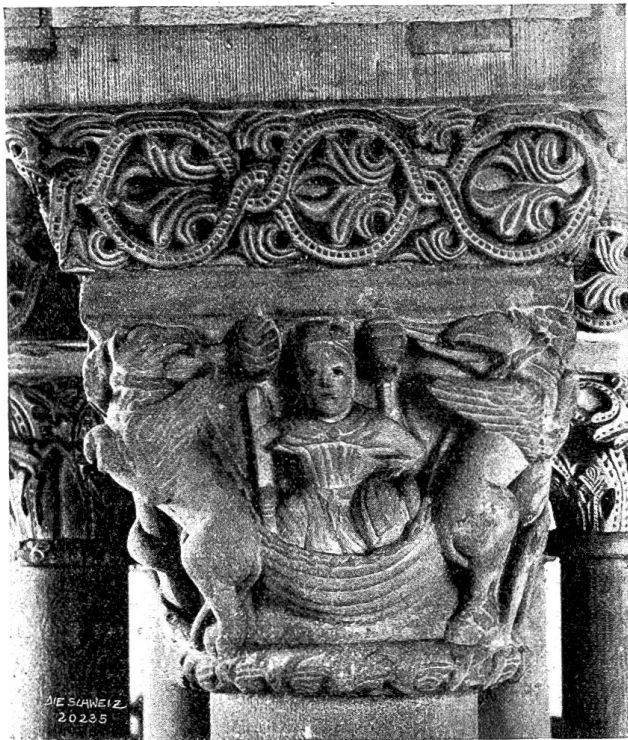
Dom Basler Münster Abb. 3. Himmelfahrt Alexanders des Großen. Säulenkapitell im Chorumgang (1. Hälfte des 13. Jh.'s).