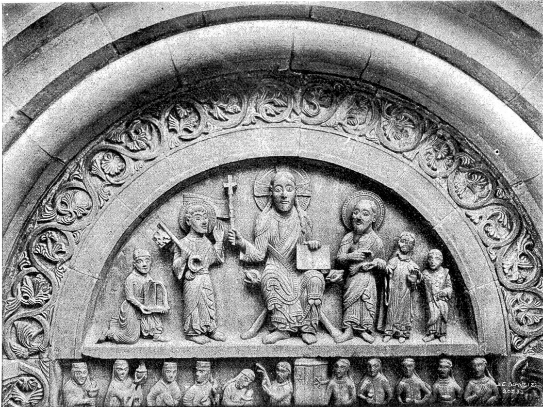
Vom Basler Münster Abb. 1. Tympanon der Gallusspforte (c. 1180). Oben: Christus thronend zwischen Petrus, Paulus und den Stiftern; unten: l. Christus und die klugen Jungfrauen (vgl. Abb. 2), r. die törichten Jungfrauen.