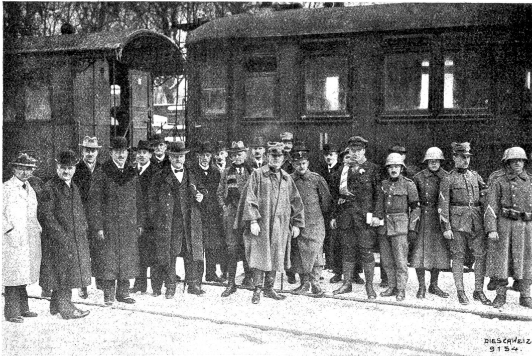
Die Ankunft des Schweizer Liebesgabenzuges in Wien. Der Empfang der Delegierten.

ßig soll im Eigentum der Allgemeinheit bleiben. In erster Linie werden bei der Landverteilung Kriegsinvalide, geistige Arbeiter, die durch den Krieg ihre Stelle verloren haben, verheiratete Dienstboten, Auswanderer usw. berücksichtigt. Das gute Beispiel mit der Landverteilung gab Graf Karolvi selbst, indem er damit auf seinen eigenen Gütern den Anfang machen ließ. Wird diese Maßregel vollständig durchgeführt, so vollzieht sich in Ungarn eine wirtschaftliche Veränderung, die stärker in das politische Leben eingreift als alle Reformen, die bisher vorgeschlagen worden sind.