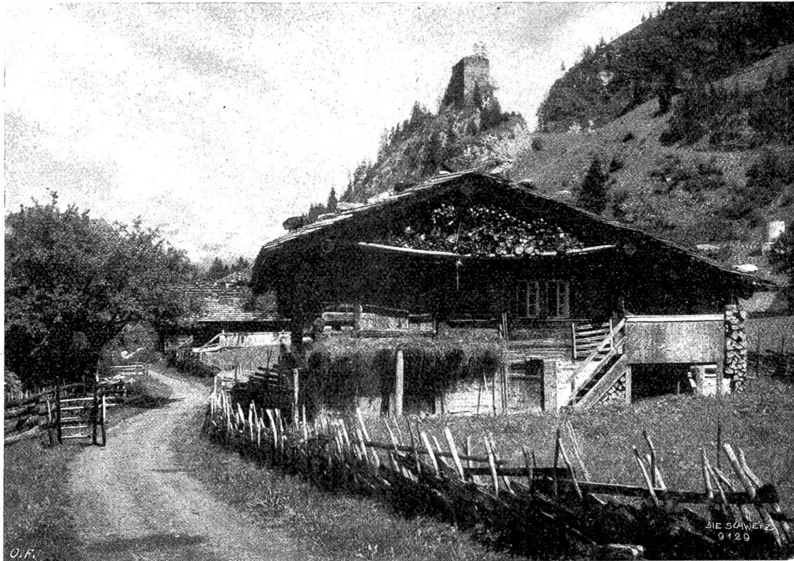
Altes Haus und Felsenburg im Kandergrund.