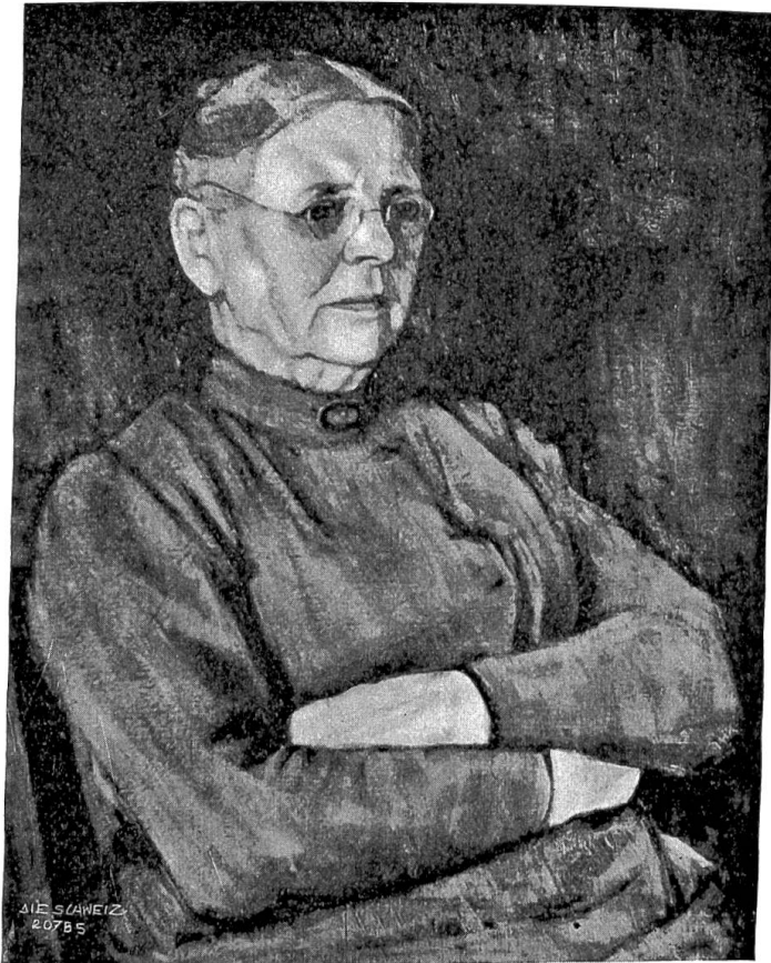
Kunstleben im Aargau.