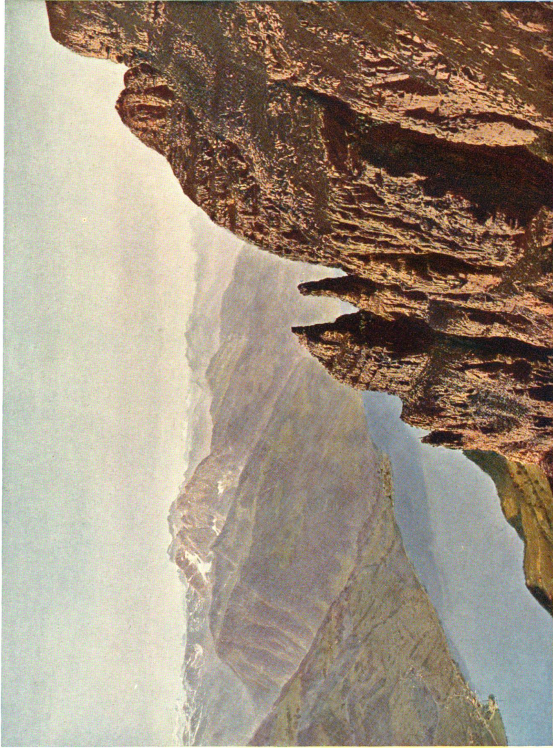
Blick in die Tiefe vom Valsloch am Hinterrud (Kurzjosten) Bergwärts fallende Kalffschichten, durch Erosion in groteske Türme gegliedert. In der Tiefe der Walensee; jenseits Murg, Märtschenstock und dahinter der Glärnisch