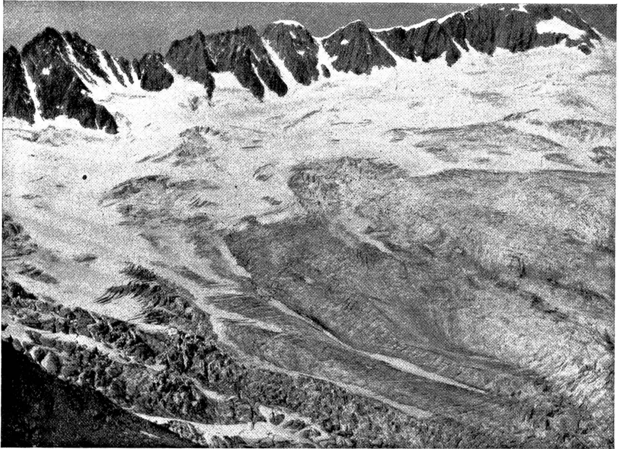
Dammfirn und Gletscher, von der Winterlücke gesehen. — Prächtiges fließendes Herauswachsen der zerrissenen Gletscherströme aus dem weiten Firnkessel. Oben: umrandete Firnklust, darüber die steilen Granitplatten-Quergräte des Tiefenstocks, Rhonestocks (mit der Firnklappe) und der Dammastöcke

des Bündnerlandes, hätte nicht Lust, irgendwo in unseren Bergen für sich im kleinen und stillen dergleichen Stoffe aufzuspüren?