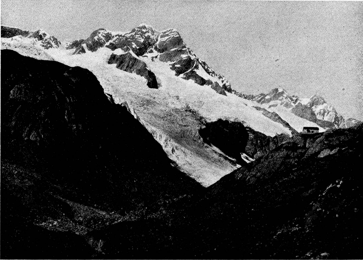
Suftenhorn mit Voralphütte der Sektion Uto S. A. C. vom Voralptal aus

silberne Firngewand des Dammagletschers, der aus weit ausgreifendem Felsgratfessel wie eine festgewordene geflossene Masse uns entgegenhängt und nach der Nordseite zum tiefen Kehlengletscherstrom überfließt. Grauweiß und rotgelb trüb schäumen auf Göscheneralp die beiden Ursprungsarme der Göschenerreiß daher, hier zerriebenen Granitschutt von der Winterstock-Rohnestockgruppe, dort vom Maachplanstock und Gwächtenhorn schwarzes Karbonschieferpulver und rostige Amphibolitgerölle aus den Seiten- und Grundmoränen der Gletscher verfrachtend. Ein auffälliger alter (längst überwachsener) Moränenhorn trennt beide am Fuße des Moosstockes, dessen niederes Alpenerlenbuschwerk ihm wohl von weitem diesen Namen eingetragen hat.