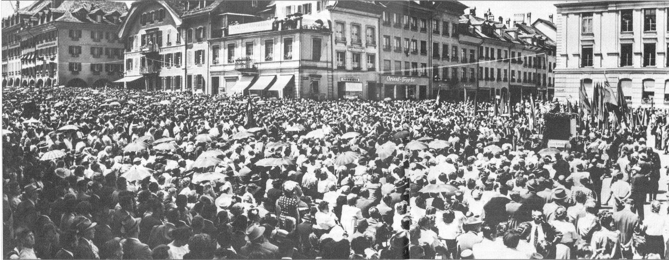
STFV-Marsch auf Bern, 15. Juni 1956

Radikale Arbeitszeitverkürzung Grundsätzlich muss das Recht auf Arbeit weiterhin