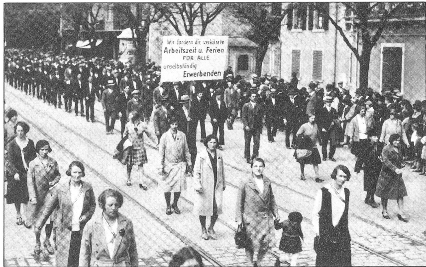
1. Mai 1938, Zürich

Noch Anfangs der 30er Jahre hatten nur wenige Arbeiter vertraglich gesicherte Ferien