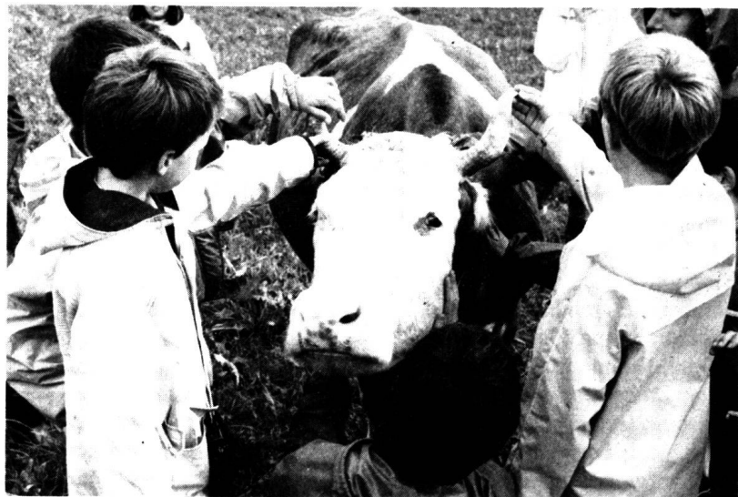
Les élèves sont invités à toucher (ici au Mont-sur-Lausanne)

entreprise un petit côté «reconstitution artificielle»: il n'y a plus guère qu'au musée du Ballenberg que le pain soit fait de cette façon et celui que nous mangeons passe par des étapes beaucoup plus mécanisées. Mais qu'importe, pourvu que la démarche soit honnête: les visiteurs peuvent être avertis et deviendront d'autant plus critiques face à des produits de facture industrielle, ou exigeants dans la recherche de produits de qualité. L'honnêteté est également nécessaire pour bien comprendre la relation entre l'homme et l'animal: les si jolis petits lapins qui courent dans l'herbe sont destinés à être tués, tout comme les vaches ou les poules. Pour éviter le côté «musée», il est important, selon Bruno Dumont, animateur de l'expérience lausannoise (voir encadré), que «les enfants vivent la ferme. Ils ne viennent pas regarder des vitrines, mais participer aux tâches: nettoyer l'écurie, s'occuper des bêtes, du jardin, etc. Ils y vivent des moments forts, parfois difficiles, lorsqu'ils se rendent compte qu'il faut tuer une poule ou que les lapins