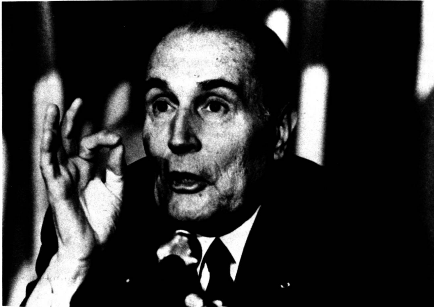
François Mitterrand, le meilleur représentant du Scorpion en politique.

Etant entendu que contrairement à une opinion fort répandue l'astrologie interprète, tel un diagnostic, le ciel de naissance, laissant ensuite chacun libre de corriger la nature ou de s'en accommoder: comme une personne de faible vue est libre de corriger sa vue par des lunettes, ou un bébé grassouillet peut développer par la suite sa musculature... DP