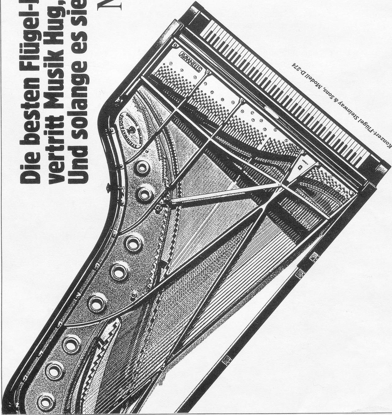
z. B. Konzert-Flügel Steinerway & Sons, Modell D-274