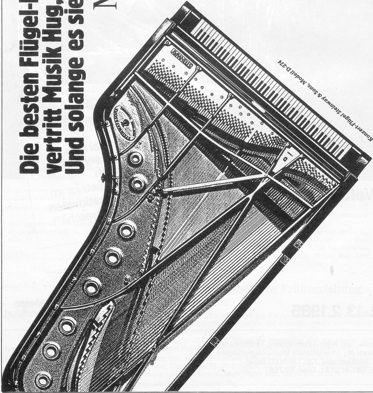
z. B. Konzert-Flügel Steinway & Sons, Modell D-274