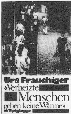
Verheizte Menschen geben keine Wärme (Br., 144 S., Fr. 26.-/DM 29.-)

Wie weckt man Kreativität? Gibt es Heilmittel gegen den drohenden Verlust unserer Hörfähigkeit, den Abbau des "Verstehens"? Gegen die Polarisierung, die musikalische Umweltverschmutzung, die allgemeine "Hinrichtung der Sinne"? Liegt in den "muischen Fächern", in der Erwachsenenbildung eine Chance? Sind Kulturinstitute aktuell und zu etwas nütze? Welches sind die Aufgaben ihrer Träger, der Lehrer, der Künstler, der öffentlichen Hand, der Liebhaber? Was wären die Kriterien für eine sinnvolle kulturelle Tätigkeit?