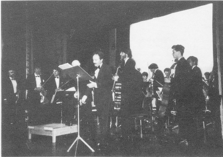
«Miroir 86»: «Renaissance» et «Rückblick» classique

aux trois quarts par des subventions de cantons, villes, fédérations et fondations. Pour le reste on comptait sur la présence de 15'000 visiteurs. Il y avait finalement pas mal de monde.