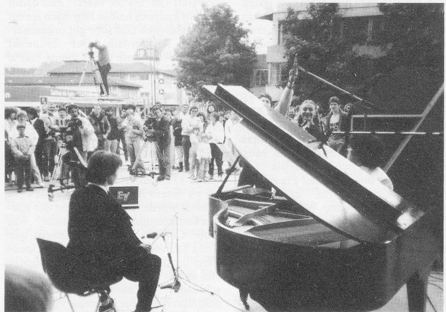
« Miroir 86 »: La culture télévisée

Planète, création — les grands mots et la prose ampoulée étaient au rendez-vous. Bienheureux artistes de «Suisse