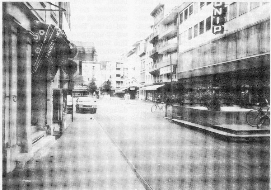
«Miroir 86»: Une folle ambiance dans les rues de Bienne

entrer dans une pinte restée ouverte. Les bistroquiers n'avaient appris qu'au dernier moment qu'il y aurait éventuellement des visiteurs dans la ville. Par la presse locale.