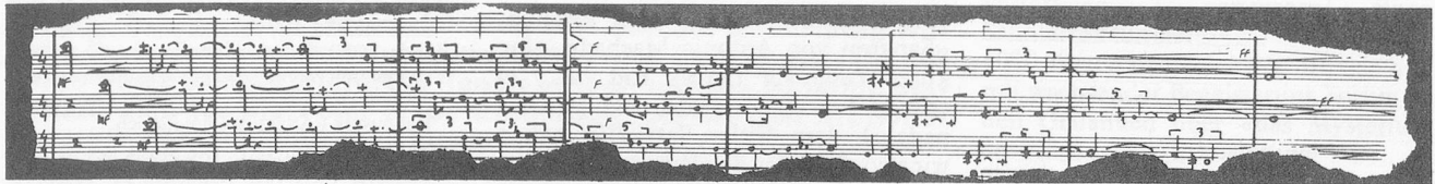
Beispiel 2: C. Halffter, Requiem por la libertad imaginada , UE 15632, Copyright 1972, mit freundlicher Genehmigung