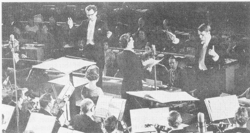
Uraufführung der Kantate «Yes, speak out» in den Vereinten Nationen

auch in der elektronisch verfremdeten und dadurch «musikalisierten» Wiederholung voll verständlich bleiben. Diese Schicht unmittelbaren Engagements wird in den Kontext eines musikalischen Kunstwerks gehoben durch eine vom Chor (und Tonband) realisierte zweite Schicht, die teils als moderne vokale Klangkomposition mit Clusterbändern, teils unter Rückgriff auf historisch ältere Tonsatzmodelle gestaltet ist und die als Textkomposition des Kyrieleyson zu Beginn und der Seligpreisungen der Bergpredigt nach Matthäus im weiteren Verlauf durchgängig einen religiösen Gehalt verwirklicht. Indem diese zweite Schicht ruhig-statisch am Beginn und am Ende des Werkes allein erklingt, in der Mitte indessen, während der aufrüttelnden gesprochenen Rede, in den Hintergrund tritt, ergibt sich musikalisch eine klare Bogenform, welche in zwingender Weise das politische Engagement als eine Aktualisierung des religiösen Bewusstseins fassbar macht. 23 Eine verwandte Thematik, nun allerdings fast völlig auf die geistliche Ebene verschoben, bestimmt auch «Officium