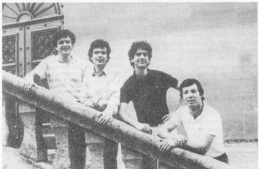
... et Sine Nomine