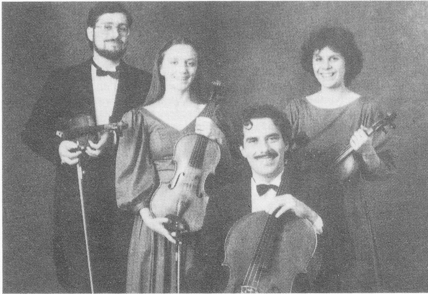
Épiques débats au sujet de deux quatuor suisses: Carmina...

Sine Nomine. Ils se communiquent leurs notes et se rendent à l'évidence: tout en préférant Carmina, ils ont donné de bonnes notes à Sine Nomine mais les trois autres jurés n'ont pas fait de même, le total de leurs points à Carmina frisant l'indécence.