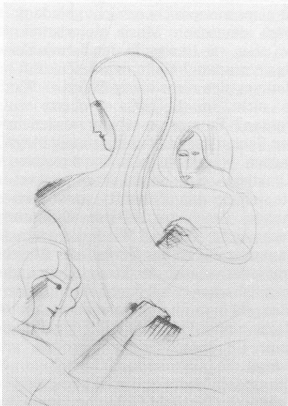
« Pettiniamo i capelli », schizzo

Oskar Schlemmer per Les Noces di Stravinsky. Per la prima volta vi è infatti integralmente esposto l'intero bozzetto elaborato tra il 1927 e il 1928 dall'artista tedesco, allora già personalità delle più marcanti fra quelle che animavano il Bauhaus, dove aveva rivoluzionato l'arte scenica con realizzazioni tra cui spiccò il Balletto triadico che segnò l'abbinamento delle idee costruttivistiche all'ambito coreografico. Oltre agli schizzi preparatori, agli acquerelli, a Lugano è stato per la prima volta presentato al pubblico il progetto nella forma di tempera su lunghi fregi in cui figurativamen-