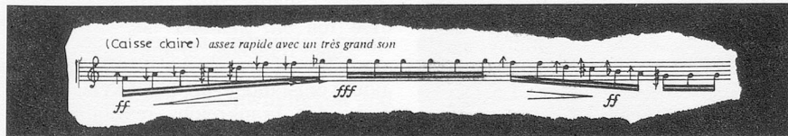
Ruban de micro-intervalles avec timbre de caisse claire (M. Levinas: «Appels»)

langage, une discipline féroce d'écriture, un artificialisme déclaré et un rationalisme décidé. La musique «opère désormais sur les paramètres significatifs du spectre acoustique dont elle sait contrôler les infimes oscillations.