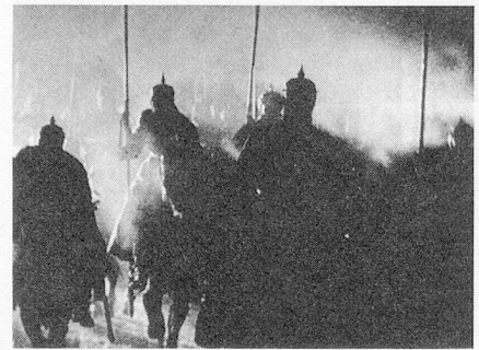
Die deutsche Invasion von Paris

So eindeutig die politische Aussage des Films ist, so doppelbödig sind bei näherer Betrachtung die stilistischen Mittel, mit denen die Klassengegensätze in Szene gesetzt sind. Vor allem die Musik begibt sich dabei kühn aufs Glatteis. Da ich darauf gesondert eingehen werde, hier ein Beispiel beunruhigender optischer Ambivalenz: Die Bürger im Film betätigen sich, wie gesagt, als Voyeurs; dauernd fuchteln sie mit Lorgnetten und Ferngläser herum. Ganz egal, ob Operette, Barrikadenbau oder Kommunar-