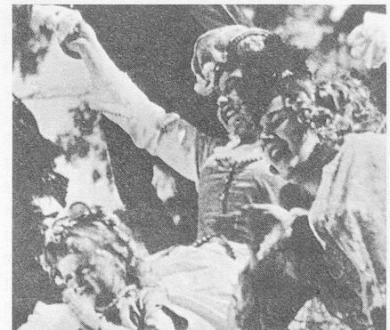
Sterbende Kommunardin und – im Gegenschuss – applaudierende Bourgeoisie

Heute wird der V-Effekt vorschnell Bertolt Brecht als Erfinder zugeschrieben. Dabei waren es die russischen Formalisten, die ihn in der Literatur einführten, und Kosinzew und Trauberg, die ihn erstmals in Theater und Film anwandten. Dazu heisst es in einem Artikel von 1928: «Es handelt sich um eine exzentrische Kombination von Gegenständen, um das Auftauchen eines Gegenstandes ausserhalb seiner natürlichen Umgebung und um die Darstellung von Beziehungen, die er mit einer Umgebung unterhält, die ihm nicht entspricht.» 15 Trauberg und Kosinzew wenden dieses Prinzip als «emotionelle Technik» an: Immer dort, wo eigentlich grosse pathetische Ge-