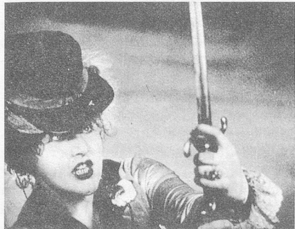
Die «Marseillaise» als Kampfgesang der Reaktion

man zur Ehre der vereinigten Imperialisten das berühmte Kampflied in bisher unerreichtem Largo-Tempo und mit ebenso rekordverdächtigem Vibrato über den Laufsteg bringt, – schon damals scheinen die Macher des «Neuen Babylon» dem Tonfall des alten Allons enfants nicht mehr so ganz getraut zu haben. Immerhin hatte zwei Jahre zuvor der französische Cineast Abel Gance in seinem «Napoleon»-Film die Marseillaise für eine höchst fragwürdige, bei-