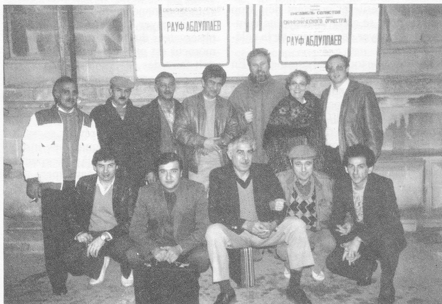
Schweizer und aserbaidjanische Musiker in Baku