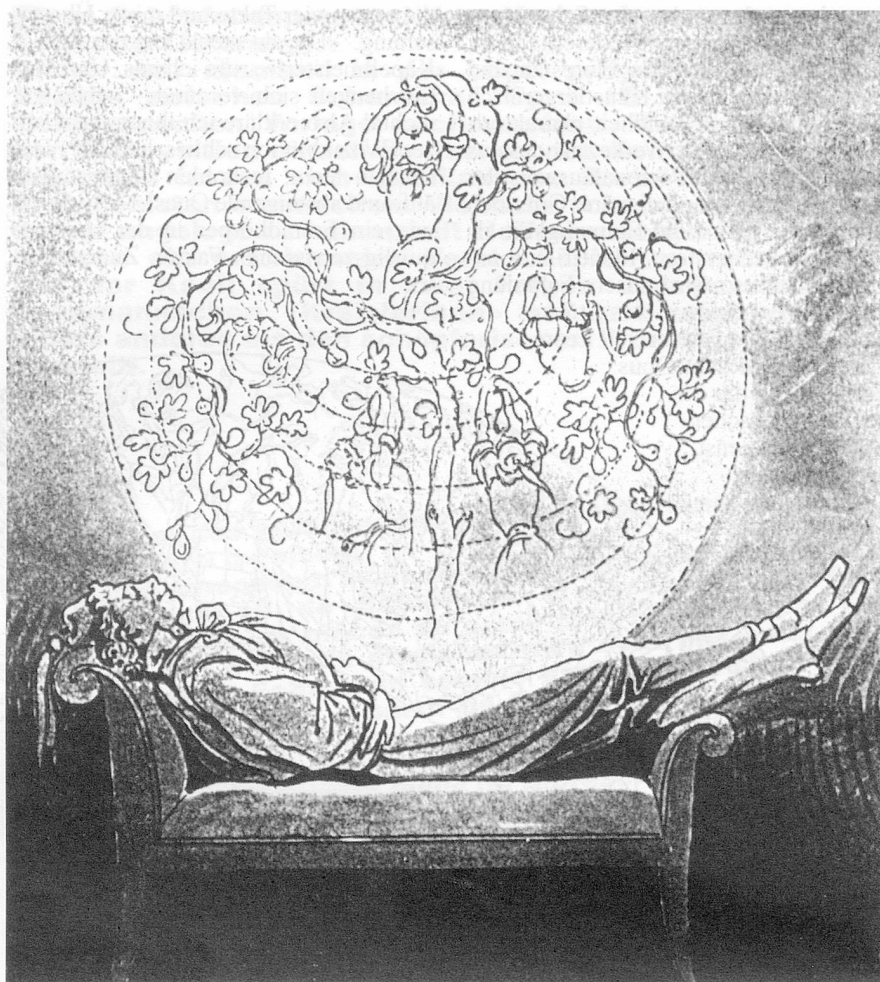
Der Traum (Sepiazeichnung von Moritz von Schwind)

mal während eines Seminars eine ähnliche Idee kam, und wir einen vergnüglichen Nachmittag damit verbrachten, Adorno-Analysen aus dessen Mahler-Buch in Musik zurückzuverwandeln. Noch sehe ich Kagel, zwei grosse, grüne Plastikdeckel hinter seine Brillengläser geklemmt, wie einen Blinden zwischen unseren Notenpulten herumtapsen, während er herzerweichend «Alma, Alma!» wimmerte. Schwankte so bereits Schumann durch das Hoffmannsche Feuilleton und rief nach seiner Clara? Eine derartige These verdient wahrhaft geprüft zu werden. Und siehe da: Umgehend fällt uns schon ein erster Hinweis zu. Die Kreislerschen Aufsätze sind nämlich keine simplen Werkbesprechungen. Beileibe nicht! Der Kritiker, der da am Werk ist, greift selbstbewusst in die ihm vorliegenden Partituren ein, schreibt sie um, auch wenn es die Bachschen Goldbergvariationen sind. Soviel Chuzpe lässt aufhorchen! Zudem: Hat nicht auch Schumann, gerade zu der Zeit, da er an seinen «Kreisleriana» arbeitete, bekannt, dass ihm «Bach ein täglich Brot» sei? 3 Und siehe da: Das siebte Stück im Opus 16 ist eine Toccata mitsamt Fugato in auffallend Bachscher Manier. Es handelt sich überdies um jenes Stück, von dem immerhin ein Kenner wie der Pianist Eduard Steuermann meinte, dass es zugleich «das verrückteste» der Sammlung sei. 4 Nun, verdichtet sich