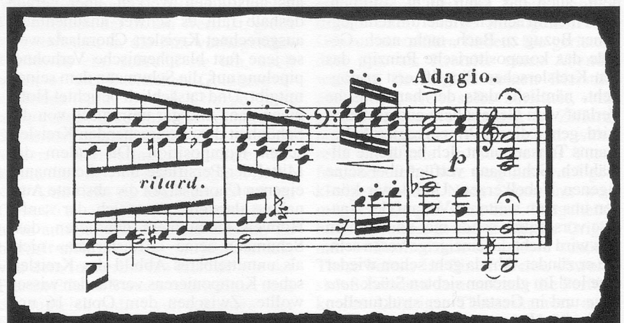
Beispiel 2: Nr. 2, T. 34 ff.

rechte tut (Nr. 8, T. 25 ff.). Schumann hat sich mit Kollege Kreisler zusammengetan, mit vereinten Kräften bringen sie ein hübsches, kleines Kompendium des Schöpferischen auf den Markt. Dem Thema entsprechend ist ihr Handbuch ausgesprochen ungeordnet ausgefallen. Da mir aber nunmal die Aufgabe obliegt, wenigstens für etwas