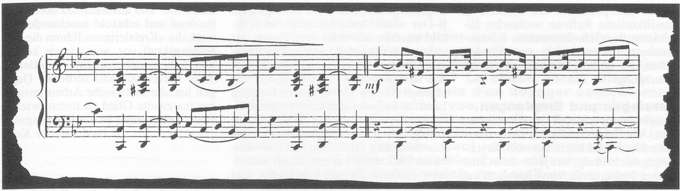
Beispiel 3: Nr. 5, T. 101 ff.

Einsicht zu sorgen, hier mein Ordnung schaffendes Register zum klingenden Handbuch. Und als erste Eintragung rangiert dort: