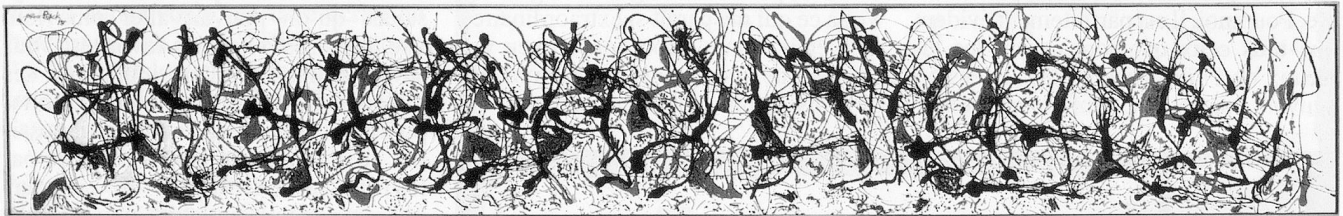
Jackson Pollock : Summertime (1948 – Tate Gallery)

Divergences, oui, mais il y en avait toujours eu, comme je l'ai dit déjà dit. Ce qui est extraordinaire, c'est que ça ne changeait rien à la chaleur de nos rapports. Nous ne terminions pas nos conversations musicales en colère.