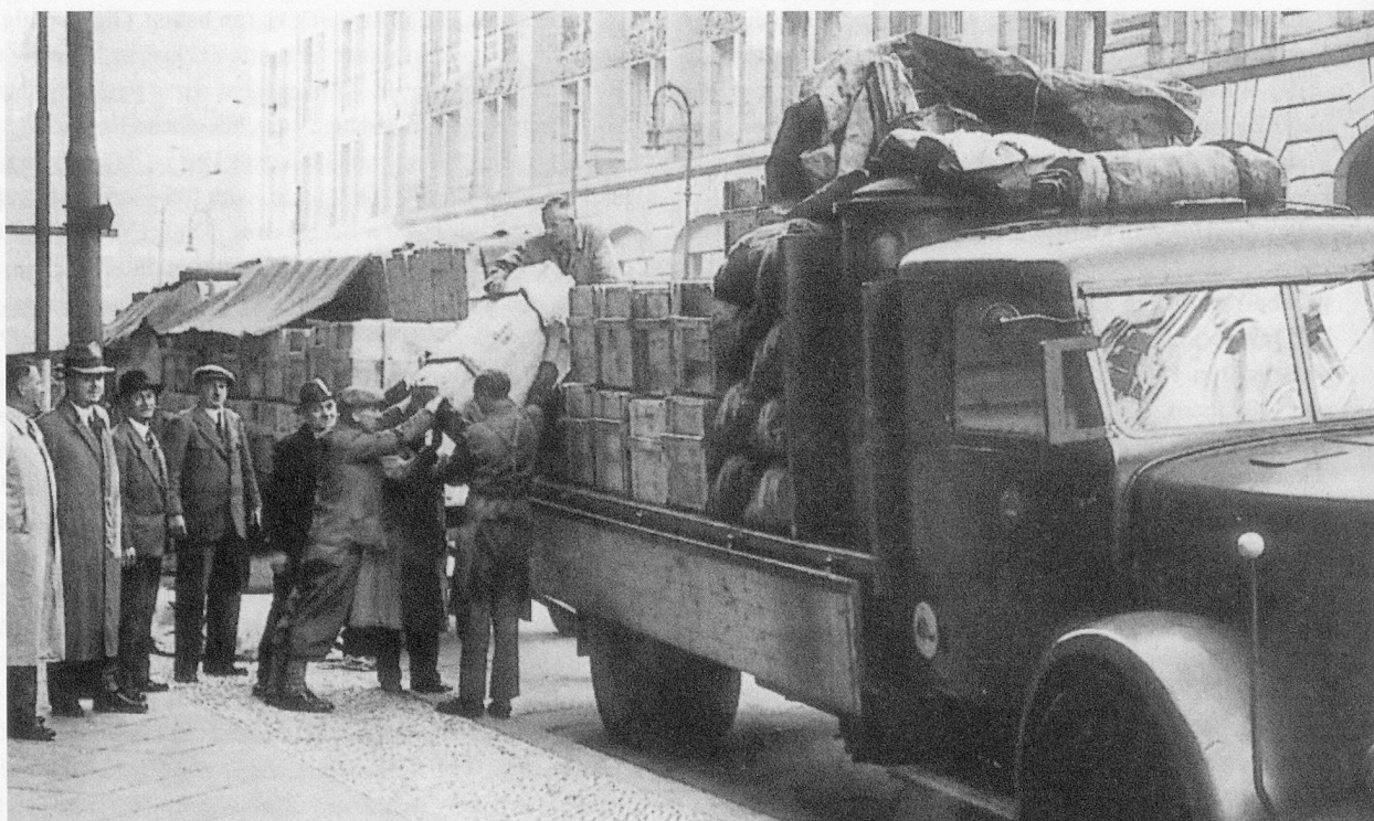
Verladen der Bücherkisten vor der Staatsbibliothek, Berlin 1941