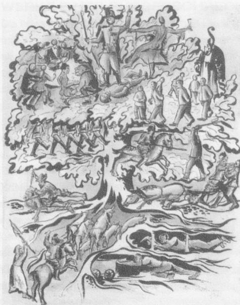
Zeichnung zu «Simplicius Simplicissimus»