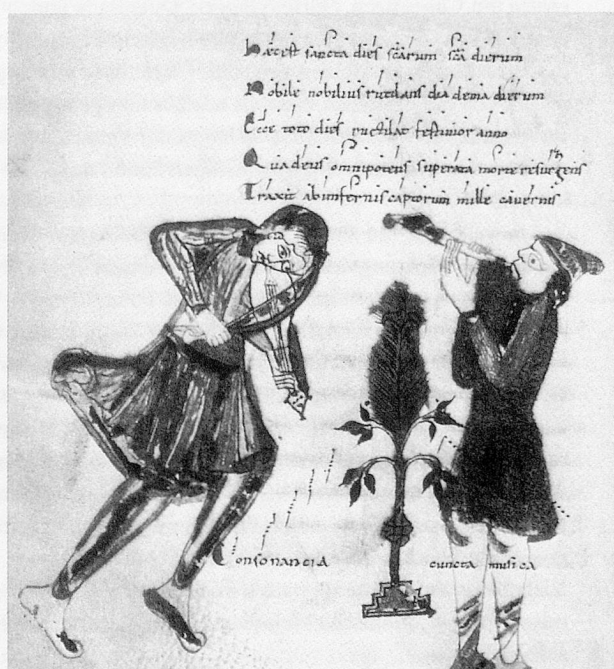
Handschrift aus dem 13. Jahrhundert