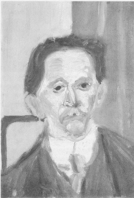
Zemlinsky, Porträt von Arnold Schönberg