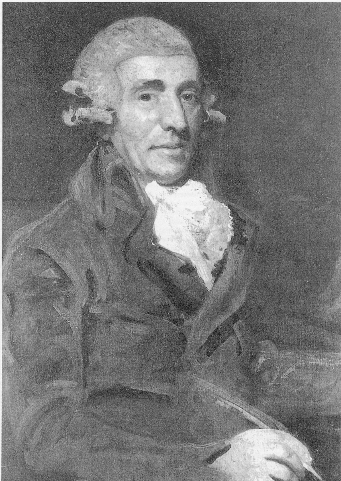
Joseph Haydn. Portrait de John Hoppner (1792)

Commencer et terminer une composition – le triomphe de Haydn