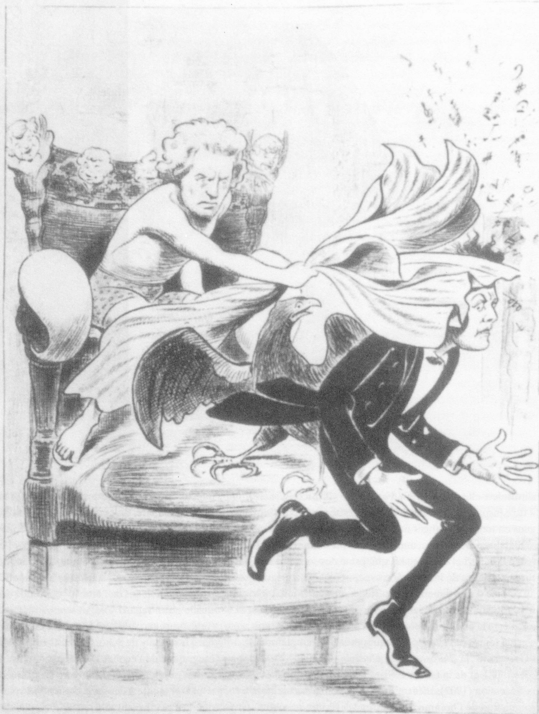
Caricature publiée dans «Kikeriki» à l'occasion des fêtes Beethoven organisées par la Sécession viennoise en 1902 (avec la statue Beethoven de Max Klinger)

Beethoven: Hab' ich Dich endlich! Na wart', Du Symphonieverhuner!