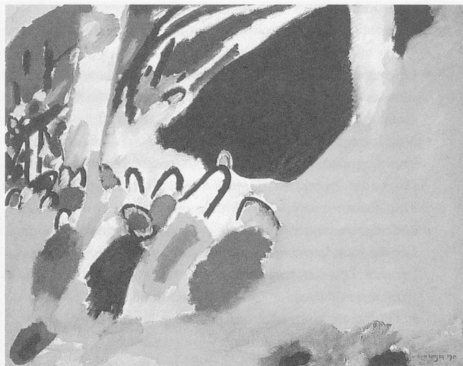
Wassily Kandinsky, «Impression III, 1911»

Visualiser et développer ses propres idées est important pour que les improvisations puissent être conservées et répétées. Mais il se produit aussi un transfert sur un autre plan : le transfert de la succession notée du temps. Les proportions apparaissent. La notation entraîne à son tour des réflexions sur la conception initiale et approfondit donc l'acte de composition.