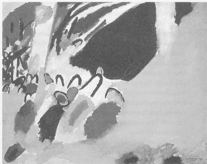
Wassily Kandinsky, «Impression III, 1911»

Visualiser et développer ses propres idées est important pour que les improvisations puissent être conservées et répétées. Mais il se produit aussi un transfert sur un autre plan : le transfert de la succession notée du temps. Les proportions apparaissent. La notation entraîne à son tour des réflexions sur la conception initiale et approfondit donc l'acte de composition.