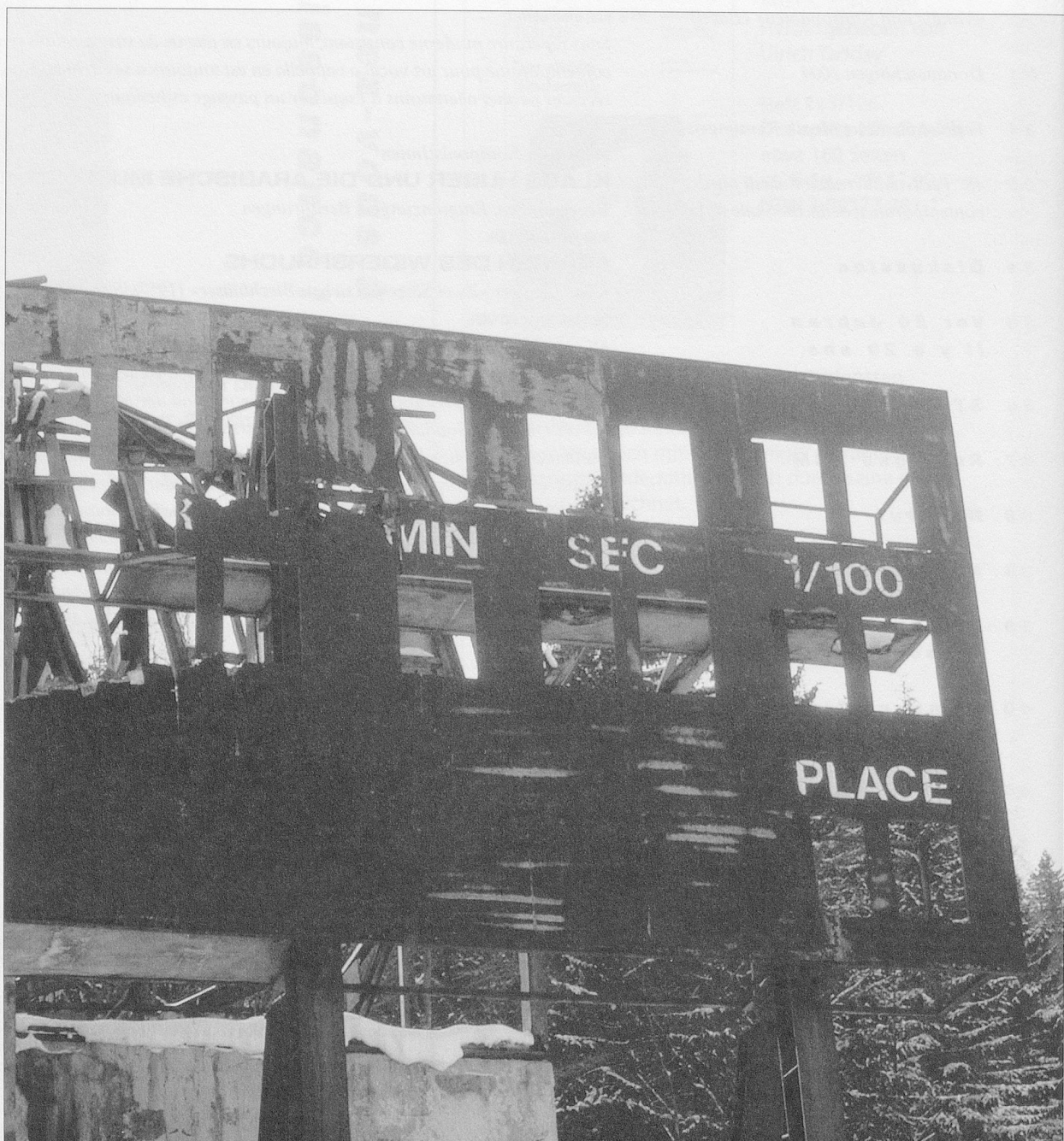
Olympia- Anlage, Sarajevo 2004