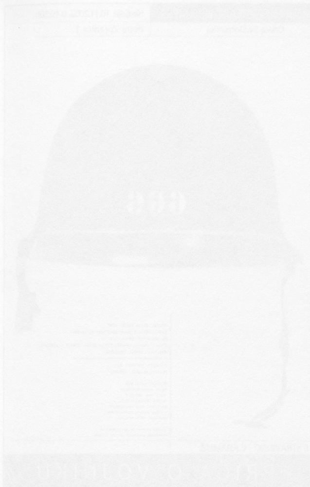
Abbildungen: Konzert- Plakate Sonemus