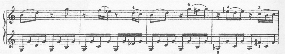
Notenbeispiel 4: KV 330/III, Takt 77-93