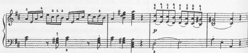
Notenbeispiel 1: Sonate KV 311 / I, Takt 36-39

In der neueren Musik, keineswegs nur in der Zwölfton- und in der seriellen Musik, sind Wiederholungen von grösseren Abschnitten alles andere als üblich. Schon deshalb sollte man bei historischen Musikstücken immer wieder darüber nachdenken, ob eine vorgeschriebene Wiederholung musikalisch absolut notwendig, ob sie zwar sinnvoll aber durchaus nicht unverzichtbar, oder ob sie für die Komposition vielleicht sogar «schädlich» ist. Beim ersten Satz der Klaviersonate D-Dur KV 311 würde ich zum Beispiel die Exposition auf keinen Fall wiederholen. Diese Exposition endet mit einem hübschen Einfall, einem kleinen Seufzer-Motiv, das der kräftigen Abschluss-Kadenz überraschenderweise angehängt wird ( Notenbeispiel 1 ).