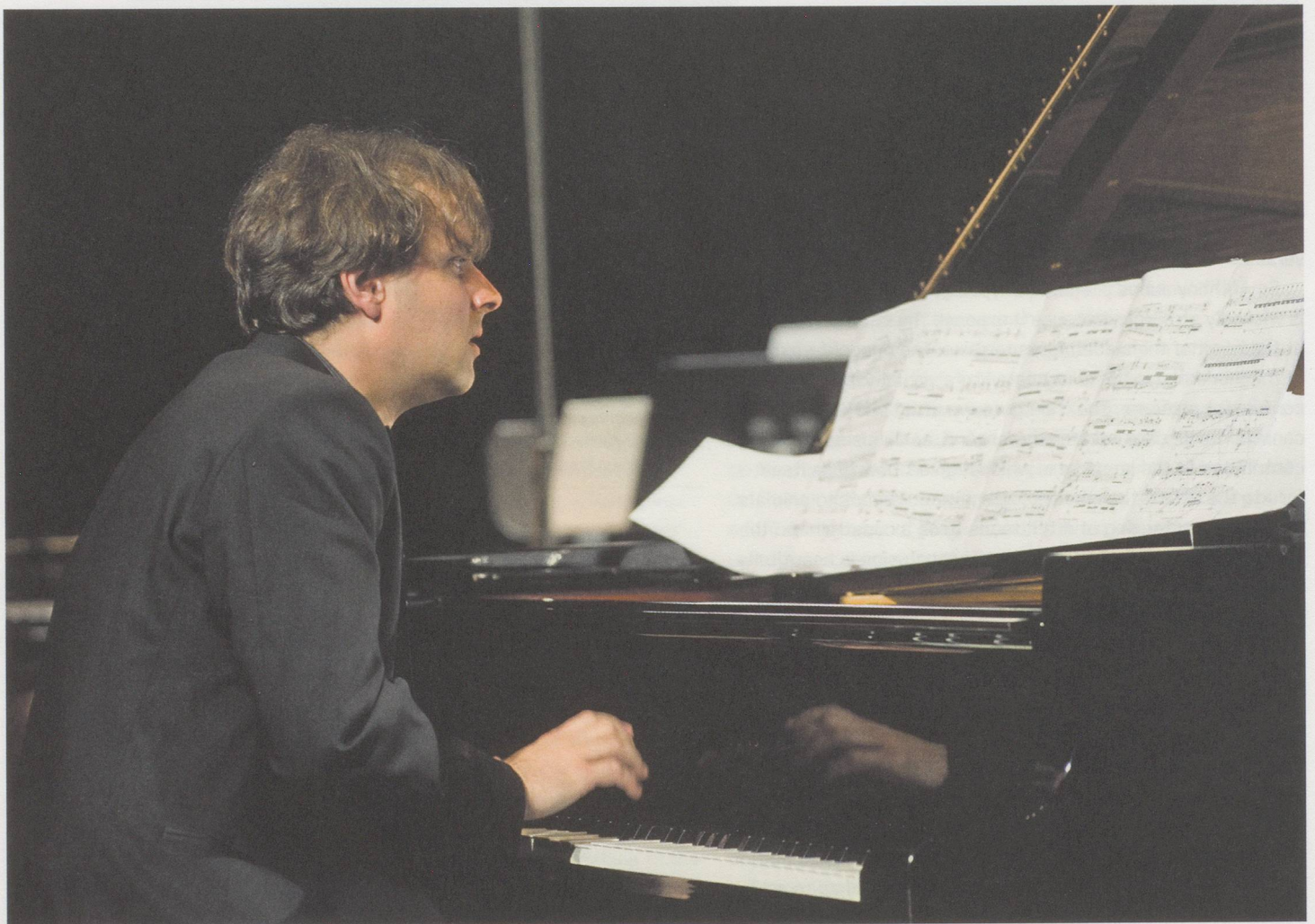
Stefan Wirth während der Uraufführung von «Le cru et le cuit» am Lucerne Festival 2010.