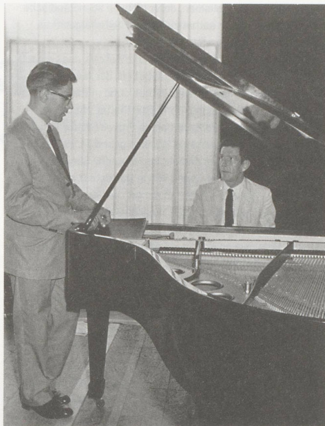
1958 an den Darmstädter Ferienkursen: David Tudor und John Cage (am Flügel).

Wie auch immer: Sein Auftritt hatte Folgen. Die Begriffe «Aleatorik» und «Indetermination» wurden zu gewichtigen