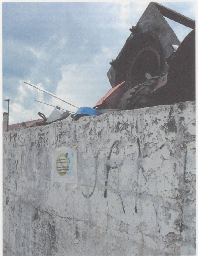
Bern, Gewerbeareal Galgenfeld, Libellenweg.

Nach dem Scheitern der Verhandlungen ergab sich für BeJazz, dem traditionell wichtigsten Veranstalter für die Berner Jazzszene, überraschend eine neue Chance zu einem eigenen Club in Form einer Kooperation mit dem Stadttheater Bern. Dieses plante just damals die Inbetriebnahme einer neuen Spielstätte in Berns Nachbargemeinde Köniz. Der in Umnutzung begriffene Gewerbekomplex Vidmar bot ausreichend Platz für eine zeitgemäss ausgestattete Theaterbühne. Aufgrund der trotz guter