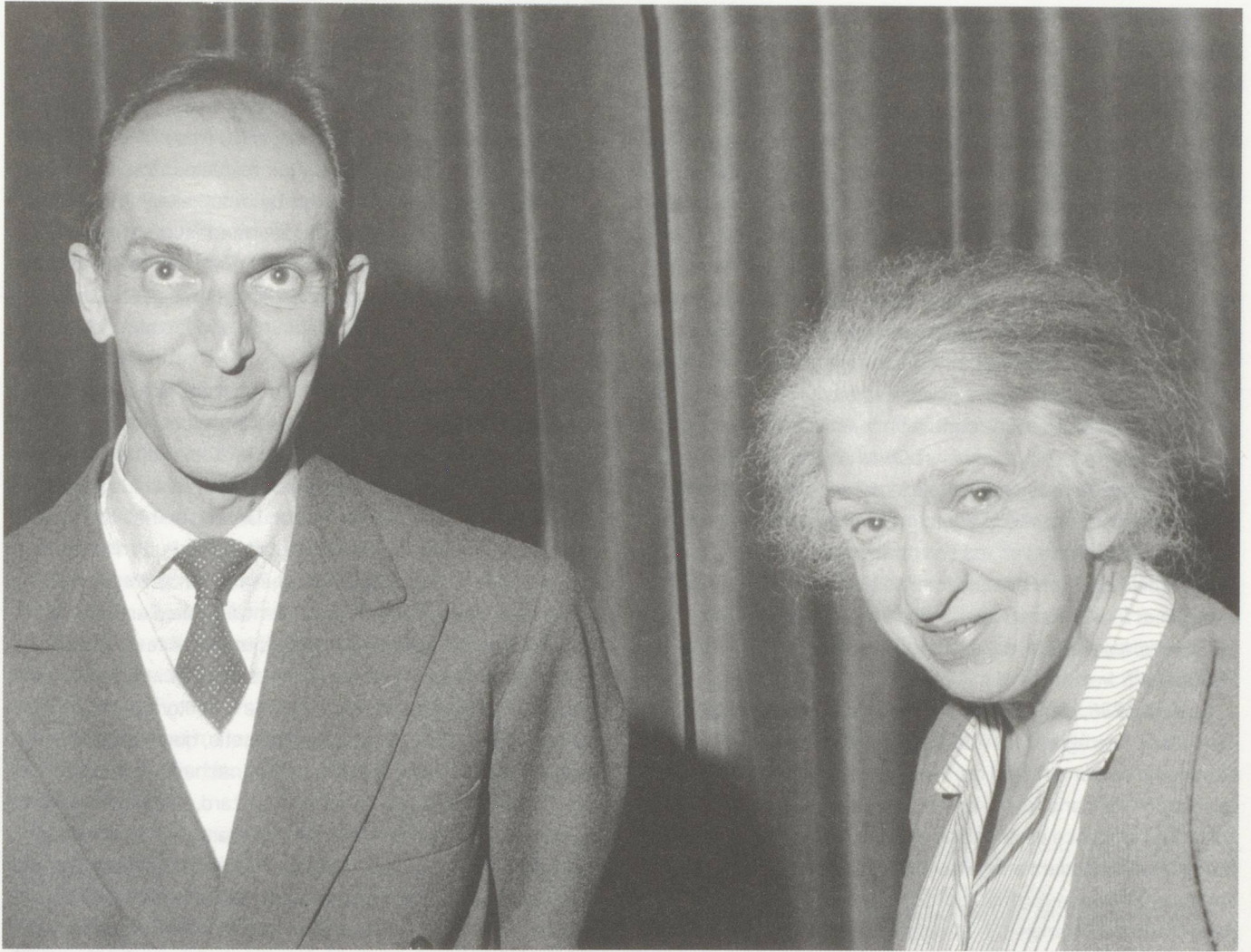
Markevitch avec Clara Haskil, lors des enregistrements du troisième concerto de Beethoven, des KV 466 et 491 de Mozart et des «Nuits dans les jardins d'Espagne» de Manuel de Falla en 1959/60.

suscitant des sifflets et des quolibets qui dégénèrent rapidement en un chahut invraisemblable. Sans doute, une cabale politique. « N'oublions pas qu'on était en plein fascisme et que, bien que le fascisme se piquât d'avant-garde, il avait beaucoup isolé l'Italie de la culture mondiale, de sorte que les nouveautés y étaient facilement suspectes 9 . »