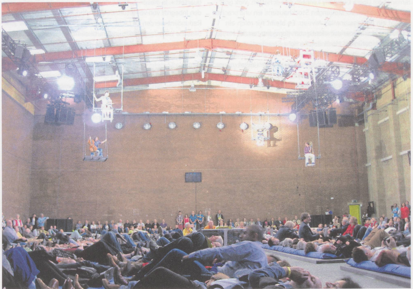
Stockhausen, «Mittwoch aus Licht», 2. Szene «Orchester-Finalisten». Auf Schaukeln schweben die Finalistinnen und Finalisten hoch über dem liegenden Publikum.

sen; Mittwoch , die Oper der Versöhnung von Michael, Luzifer und Eva an der Olympiade uraufgeführt zu wissen, und dann noch in seinem so «vollendeten» Altersjahr. Stockhausens Biographie erscheint beinahe so, als wäre sie von Rudolf Steiner designiert worden; alle sieben Jahre gibt es grundlegende Ereignisse und Wechsel: Als er 14 Jahre alt war, wurde seine psychiatrisch internierte Mutter in den Euthanasieverfahren der Nazis mit dem Einverständnis seines Vaters getötet und Stockhausen selbst in eine nationalsozialistische Kadettenanstalt gebracht; mit 21 Jahren entschied er sich, nicht