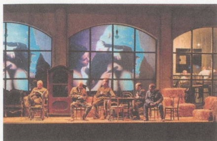
« Les Soldats » dans la mise en scène d'Alvis Hermanis.

« Les Soldats » de Bernd Alois Zimmermann au Festival de Salzbourg (Felsenreitschule, 19 août 2012)