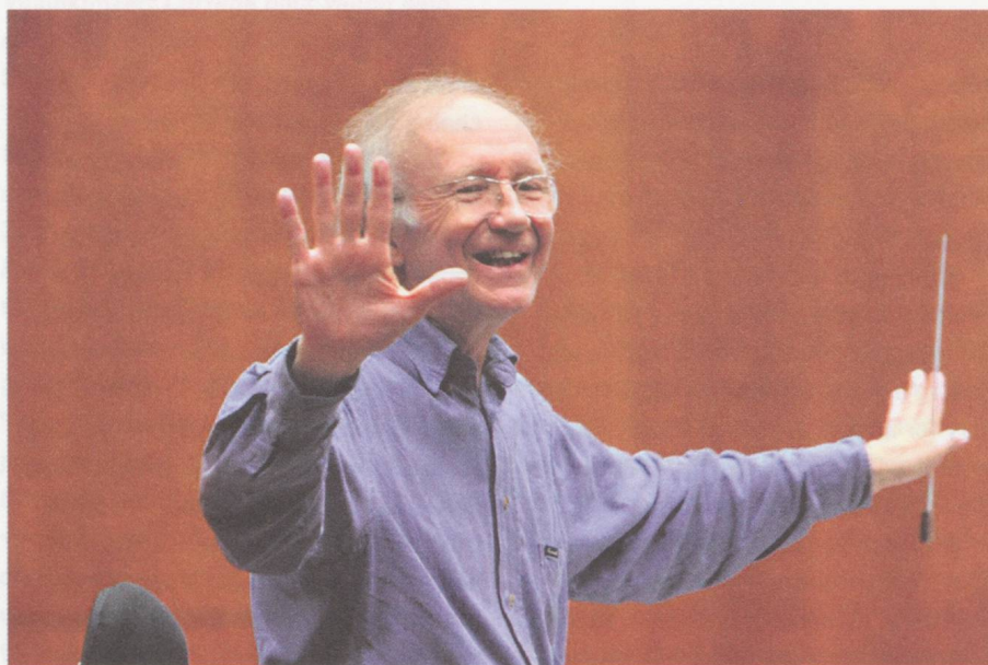
Heinz Holliger.

Festival Manifeste, IRCAM, 29 mai au 30 juin 2013