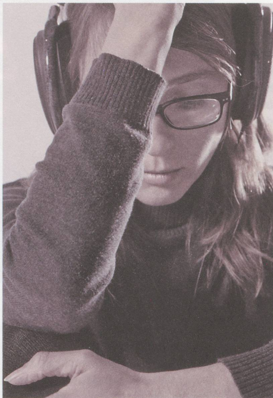
Antye Greie.

Die Lange Nacht der elektronischen Musik, Dampfzentrale Bern (5. Juli 2013)