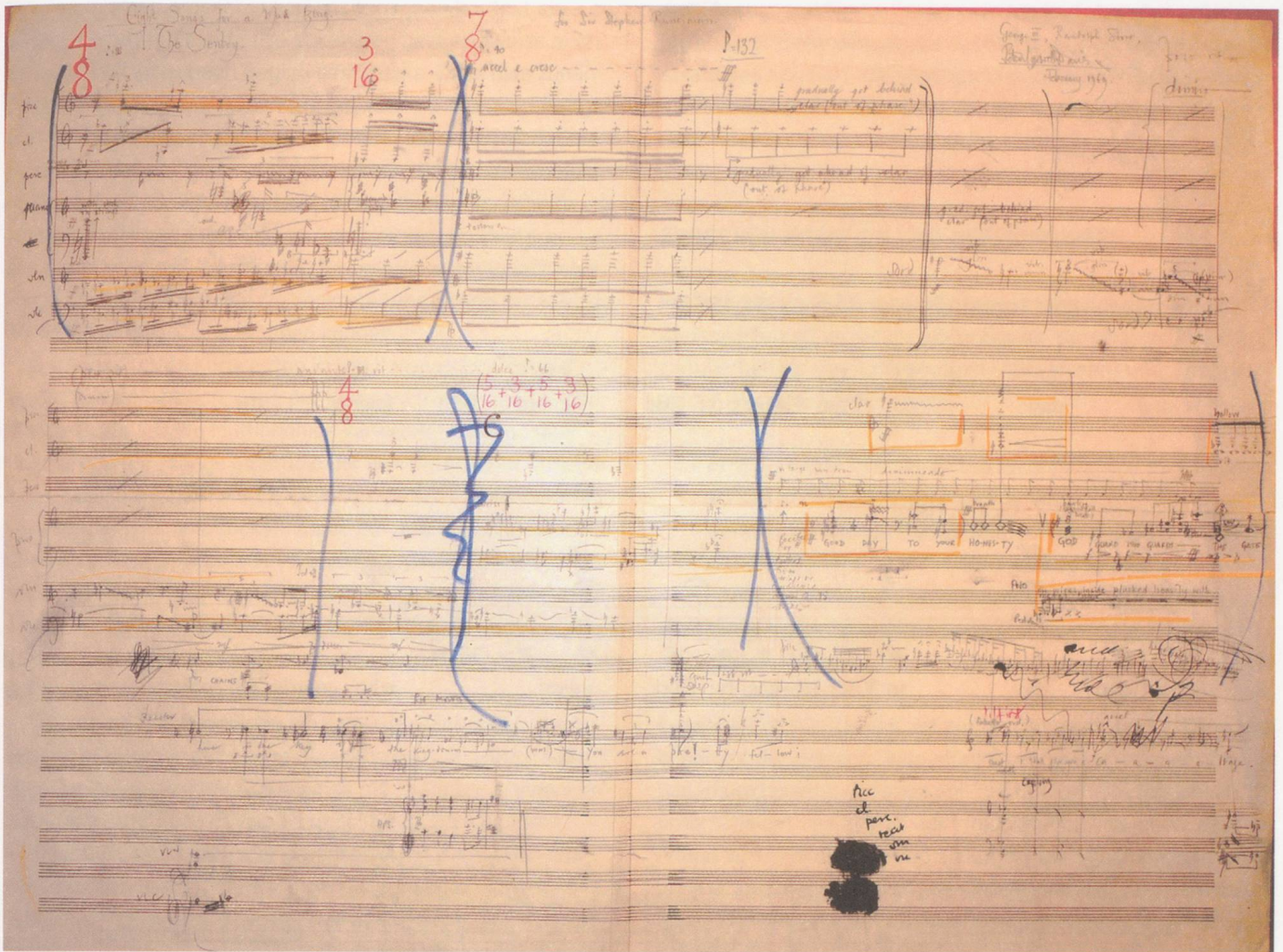
Abbildung 2: Peter Maxwell Davies, Skizze zu den «Eight Songs for a Mad King» (Februar 1969).