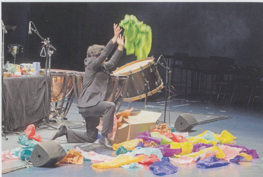
Der Schlagzeuger Thibault Lepri interpretiert «Allegro ma non troppo» von Unsuk Chin.

Der Ablauf eines Konzertes oder einer Oper folgt bestimmten Regeln: Auf der Bühne bieten Menschen etwas dar, was im Zuschauerraum von anderen Menschen mehr oder weniger aufmerksam verfolgt wird. Zunehmend gibt es in der zeitgenössischen Musik jedoch Konzepte, die dieses Prinzip durchbrechen: Besonders Kunstschaffende an der Schnittstelle zwischen Klang und visueller Kunst, zwischen installativer Performance und elektronischer Komposition suchen nach neuen Wegen der Darstellung.