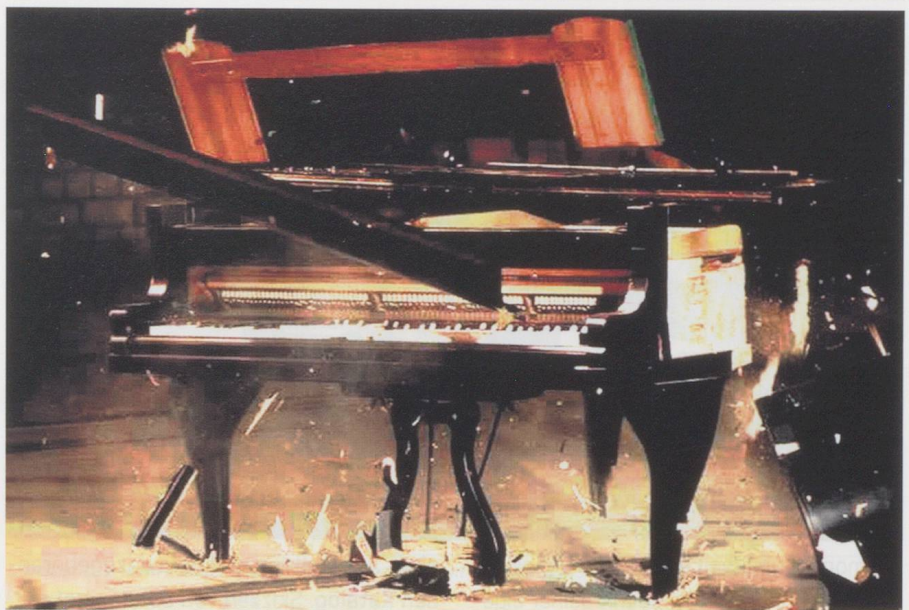
«Piano Concerto» von Simon Steen-Andersen.

«Ich bin doch nicht für zehn Lacher nach Donaueschingen gekommen», sagt der eine, und der andere am Stammtisch fügt hinzu: «Witzig ist keine ästhetische Kategorie!» Oh doch, auf jeden Fall, möchte man dazwischen rufen. Die Frage ist nur, ob die Musik das tragen kann. Und das kann sie zuweilen durchaus.