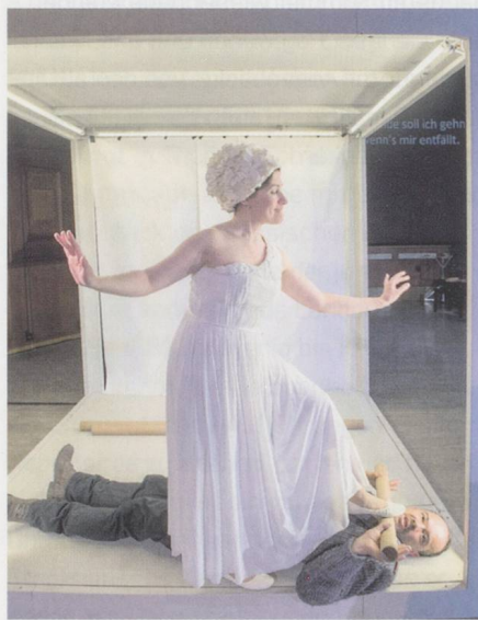
Frauenpower in «Lysistrata».

Eine baltisch-schweizerische «Lysistrata» zur Saisoneroöffnung der Basler Gare du Nord (Premiere am 23. Oktober 2014)