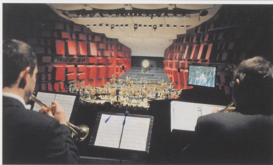
L'orchestre de la SWR Baden-Baden / Freiburg interprétant « Kraft » (1983–1985) de Magnus Lindberg.

Eine Dokumentation der Donaueschinger Musiktage 2013 ist erschienen beim Label Neos: NEOS 11411-14 (4 SACD)