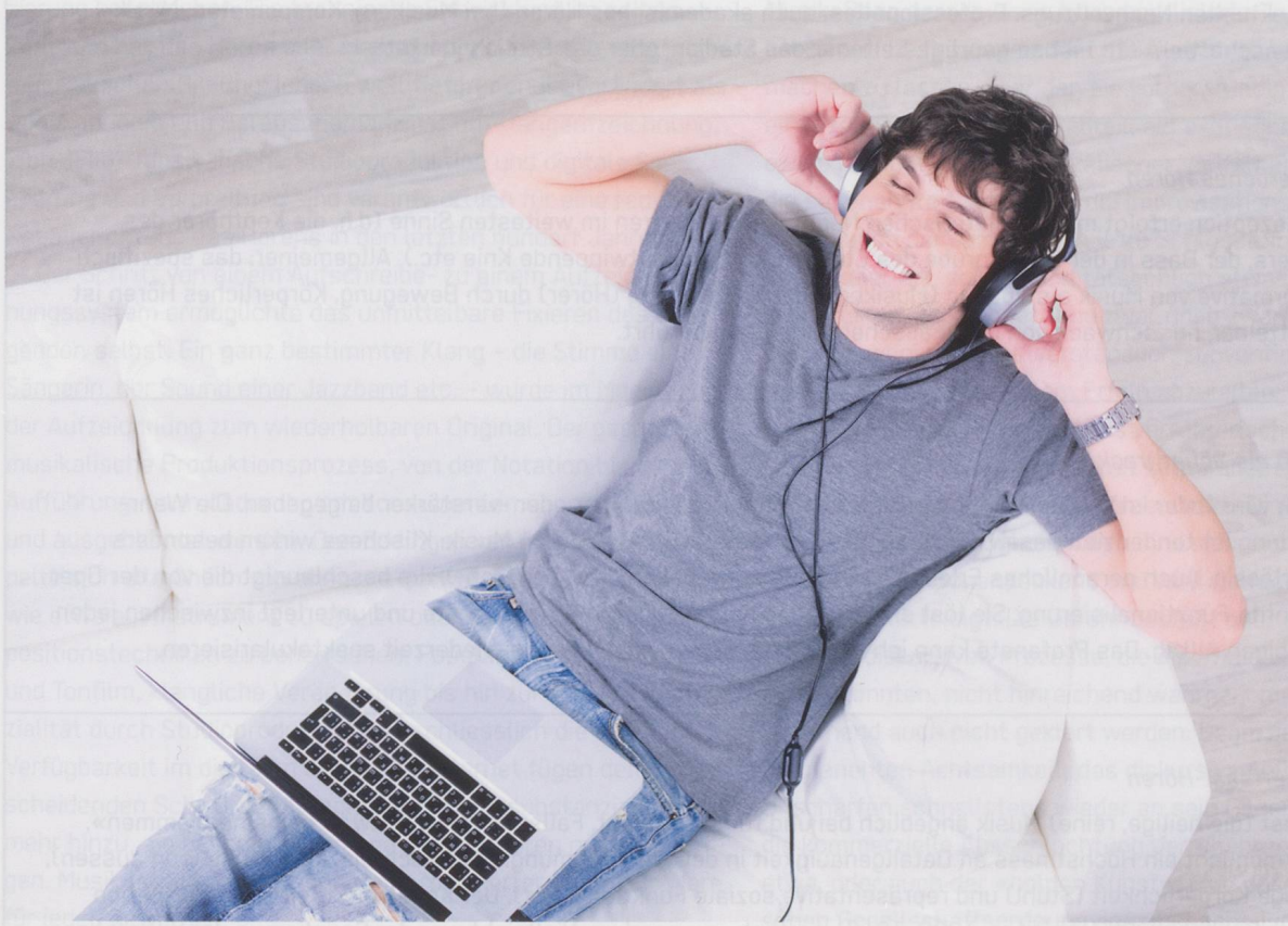
«lockerung der jungen glücklicher mann liegend auf dem sofa mit laptop und musik im kopfhörer hören» (Originallegende).

Musik 1 als diskursive Kunstform zu verteidigen kostet viel. Daher die beliebte und zeitlose Forderung, dies besser anderen Disziplinen zu überlassen. Was mit dem verlockenden Verweis auf Immanenz und Absolutheit allerdings gleich mit ausgeklammert wird, ist die Frage nach dem Preis, den es hat, Musik nicht diskursiv zu verstehen, das heisst vor allem: das Hören von Musik nicht auch als diskursiven Akt zu werten.