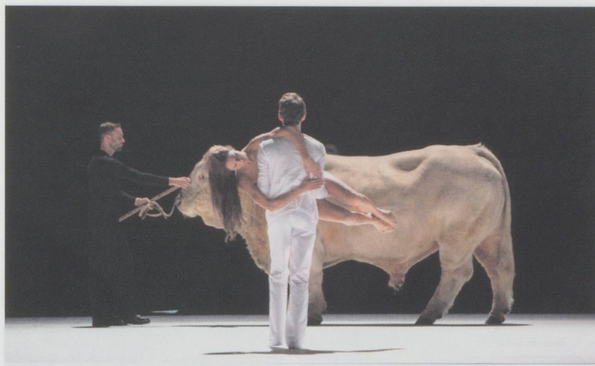
« Moses und Aron » dans la mise en scène de Romeo Castellucci.

Soirée en l'honneur de Pierre Boulez (Palais Garnier, Paris, 2 décembre 2015 - 527)