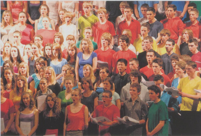
Junge Stimmen am Kirchenmusikerkongress Bern 2015: Der Chor des Gymnasiums Neufeld Bern.

5. Internationaler Kongress für Kirchenmusik Bern 2015 (21.–25. Oktober 2015)