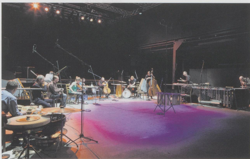
The Stone Orchestra mit Lithophonen, xylophonähnlichen Klangkörpern aus Stein.

Tage für Neue Musik Zürich (12.–15. November 2015)