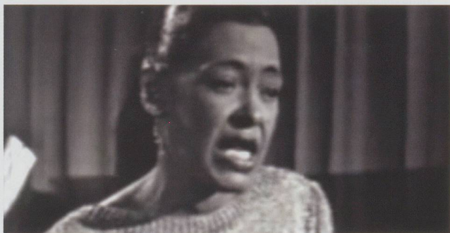
Billie Holiday, Videostill.

Ein Sprung in ein benachbartes Genre und eine frühere Zeit: Strange fruit , gesungen von der US-amerikanischen Jazz-Legende Billie Holiday (1915–1959) in einer Live-Aufnahme aus den späten 1930er Jahren. 10 Viel ist zu diesem Song, der zur Ikone des Kampfs gegen den Rassismus geworden ist, gesagt und geschrieben worden. 11 Mich interessiert hier, wie Holiday den Song durch sich sprechen lässt und worauf sie dabei verzichtet. Es scheint, als gebe es in ihrer Interpretation keinen einzigen gerade gesungenen Ton, keinen Drive, keinen Gute-