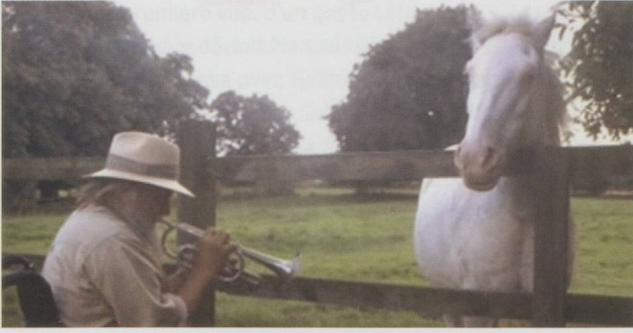
Robert Wyatt, Videostill.

Geräuschanteile und kurze Multiphonics schwingen mit. In die ausgehaltenen Töne mischen sich kleine Vibratobewegungen, Unschärfen in der Intonation und Glissandi. In den gesummen Passagen wird der Klang etwas schärfer und obertonreicher, und gegen Ende des Stücks fällt mir ein Verfremdungseffekt in der Stimme auf, der an eine Posaune erinnert – möglicherweise erzeugt durch eine mitschwingende Raumfrequenz oder durch eine nachträgliche Zumischung von Hall. All diese klanglichen Ereignisse scheinen eher zu passieren, als dass sie intendiert wären, Wyatt lässt sie zu, gestattet sich diesen direkten, unverstellten Klang. «As in folk-singing»? Vielleicht. Dieser Sänger weiss sehr genau, wie er sich von der Textstruktur, vom Rhythmus und von seiner Stimme führen lässt. Denn bei Wyatt sind es die Wörter, welche die Stimme formen, nicht umgekehrt. Er lädt die Wörter nicht auf, somit kann der Text von E. E. Cummings unverstellt durch seinen Gesang hindurchscheinen.