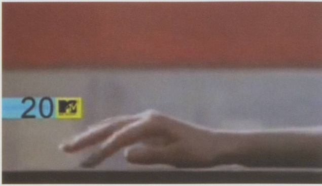
Suzanne Vega, Videostill.

Das Partizip Präsens suggeriert, dass der Text gerade eben entsteht, beim schnellen morgendlichen Kaffeetrinken an einer Bar kurz bevor der Zug fährt. Suzanne Vegas Stimme klingt alltäglich und unpoliert. Es ist eine gewöhnliche Stimme. «As in folk-singing»? Sie artikuliert nachlässig, lässt die Tonhöhen manchmal ein bisschen ausfransen, hält dann plötzlich inne, um sich einem Erinnerungsmoment hinzugeben – nichts, was dem Zuhörer mitgeteilt würde – und fährt fort wie zuvor. Das Atemholen zwischen den Phrasierungsbögen wirkt dabei wie das dezent eingesetzte Hi-Hat eines Schlagzeugs. Dieses Singen ist unangestrengt, ohne grosse Geste, ohne grosse Worte. Ein Anti-Pathos-Song, der sich am Ende verliert in einem repetitiven «dodododo» und nichts zu sein vorgibt als ein flüchtiges Erinnern, eine einfache Verzierung des Alltags? «As in folk-singing»?