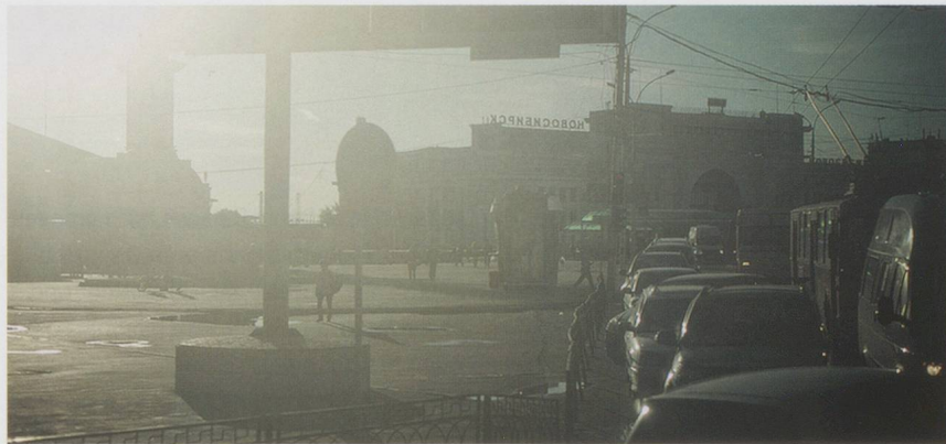
Sibérie à contre-jour.

Les photographies de Lucas Dubuis en disent peut-être encore plus que les mots. Elles montrent le contexte de la tournée et mettent en perspective différentes réalités. Ainsi, à côté des reliquats du communisme, de la grandiloquence des bâtiments du pouvoir, on découvre les lieux alternatifs de la scène de la musique improvisée. Les images