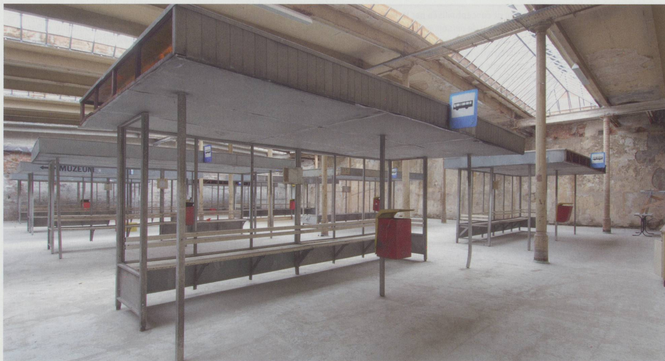
Connexions multiples ou sans issue ? Darren Almond, Terminus (2006), à la Baumwollspinnerei Leipzig.

Par ailleurs, et au delà de ces fonctions travaillées, les réseaux jouent un rôle de filtre en regroupant les artistes et les personnes qui se connaissent, se cooptent et entretiennent des centres d'intérêts communs. Ils ne sont pas différents en cela des cercles informels antérieurs mais, dans les univers de la création contemporaine où la valeur des produc-